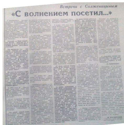
Рис. 10. Статья М. Магнитского «С волнением посетил...» в газете «Северная правда»

На портале K1NEWS.RU мы нашли такую информацию: «Костромичам было предложено назвать улицы пяти активно застраивающихся городских территорий...»