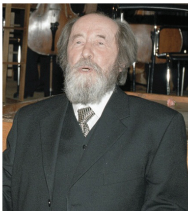
Рис. 1. Портрет А.И. Солженицына

Что связывает знаменитого писателя Александра Солженицына с Костромой? Далеко не все знают, что в годы Великой Отечественной войны именно в наш провинциальный город эвакуировали Третье Ленинградское артиллерийское училище (далее – 3-е ЛАУ), одним из курсантов которого был будущий лауреат Нобелевской премии по литературе. В марте-ноябре 1942 года Солженицын с отличием окончил учебу, получил лейтенантские погоны и прямо из Костромы отправился на фронт.