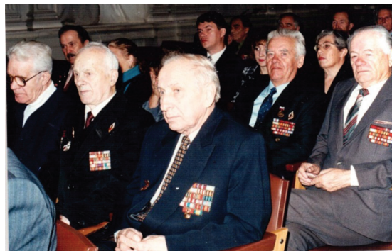
Рис. 2. Ветераны 3-го ЛАУ на одной из ежегодных встреч

«Спасибо за Ваше подробное письмо (получил его 4 апреля) и за отличную фотографию бывших выпускников 3-го ЛАУ.