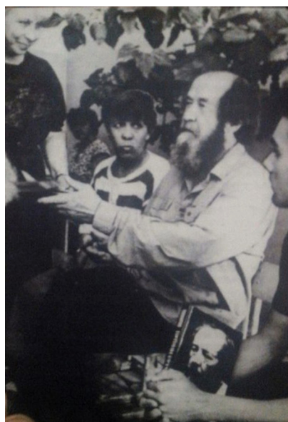
Рис. 6. Автографы – читателям (А.И. Солженицын и преподаватели лицея № 34 Г.С. Шапарова и Л.Г. Петрова)