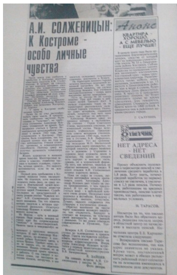
Рис. 8. Публикации о визите А.И. Солженицына в местной прессе

На портале K1NEWS.RU мы нашли такую информацию: «Костромичам было предложено назвать улицы пяти активно застраивающихся городских территорий...»