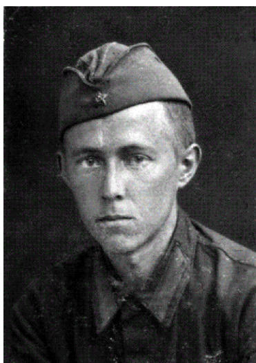
Рис. 3. А. Солженицын – курсант 3-го ЛАУ, Кострома, июль 1942 года

– В нём находился штаб и управление училища, часть здания занимала казарма. А напротив была деревянная казарма. – И показал на место, застроенное новыми зданиями. – В ней размещалась наша звукометрическая батарея дивизиона. Не думал, что снова увижу эти места, – сказал Александр Исаевич, заканчивая посещение военного городка.