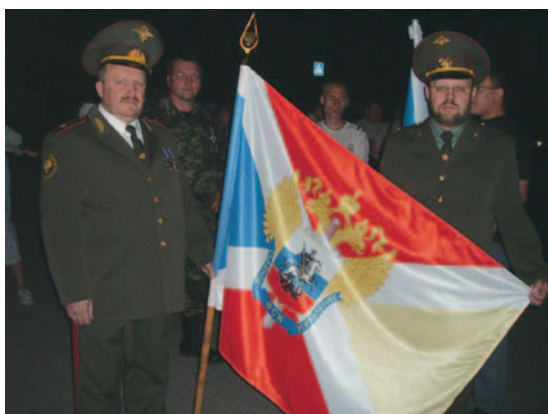
Рис.3 Флаг ФСК на сегодняшний день

Геральдическая интерпретация флага Енисейского реестрового казачества (ЕРК)