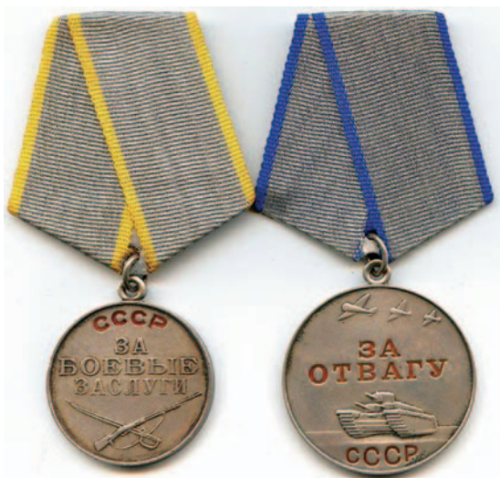
Медали «За боевые заслуги» и «За отвагу»