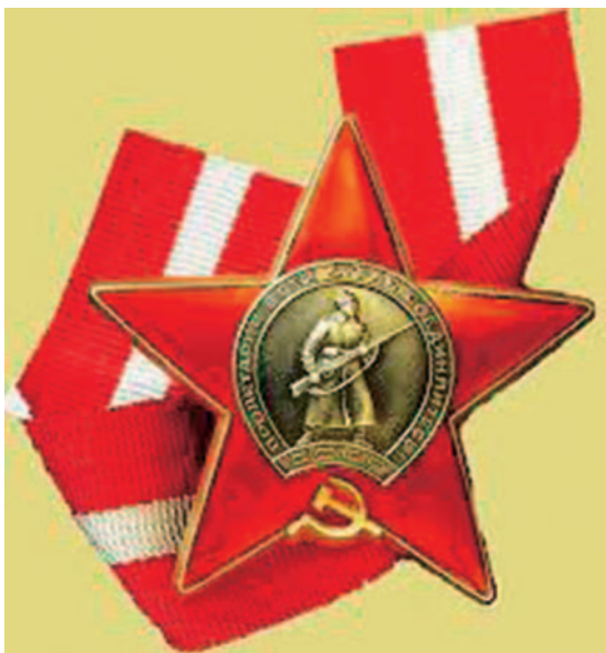
Орден красной звезды