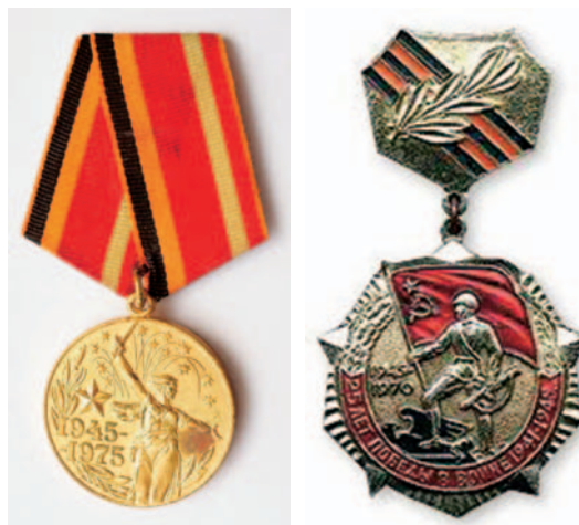
Медали «25 лет победы в войне 1941-1945г.». «30 лет победы в войне 1941-1945г.»