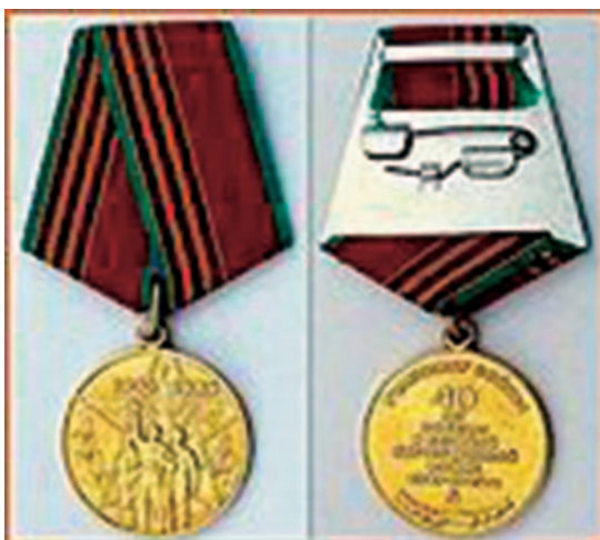
Медаль «40 лет победы в войне 1941-1945г.»