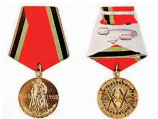
Медаль «20 Лет победы в войне 1941-1945г.Г.»