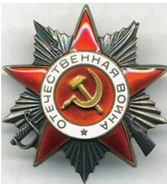
Орден отечественной войны II степени