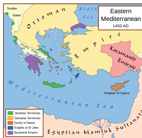
Родос и другие владения ордена.

общности было признано всеми без исключения государствами Западной Европы. Именно в таком своем качестве Орден был представлен на Вестфальском мирном Конгрессе в 1643–1648 гг., на Нюрнбергских переговорах суверенов, участников мирного договора, об условиях его выполнения и на переговорах с имперскими условиями. Орден принимал участие в заключении мирных договоров в Ниймегене в 1678 г. и в Утрехте в 1713 г., в заключении международно-правовых соглашений Польши с Россией в 1774–1776 гг. и в 1797 г. Орден был представлен постоянными посольствами при больших европейских дворах, например, в 1747 г. в Риме, Париже, Мадриде и Вене, или поверенными в делах при дворах других государств.