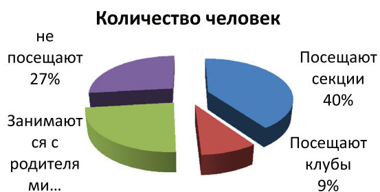
Диаграмма к вопросу № 2