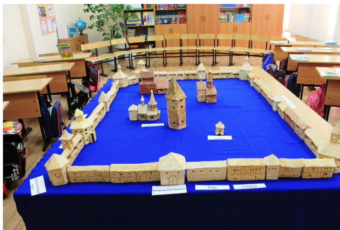
Макет Калужской крепости