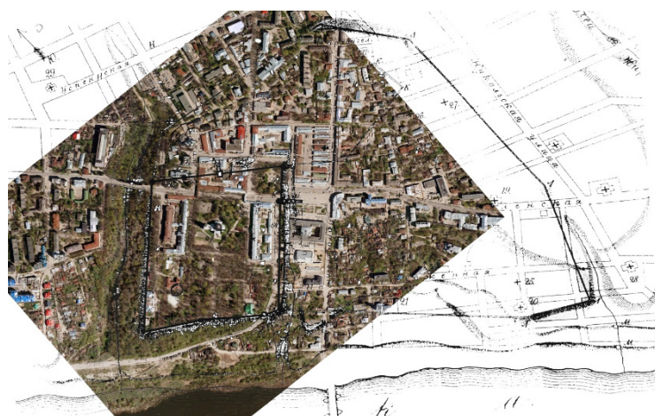
Калуга современная и план крепости и посадов