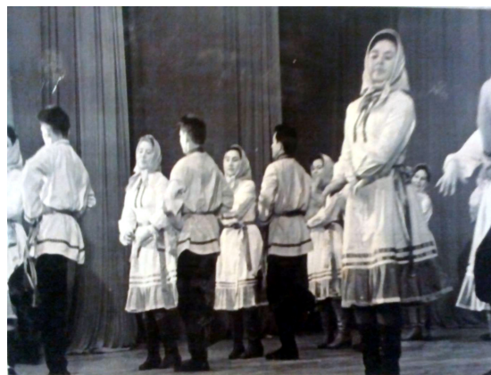
Танцевальный коллектив Калтасинского РДК на Башкирском телевидении 1964 г.