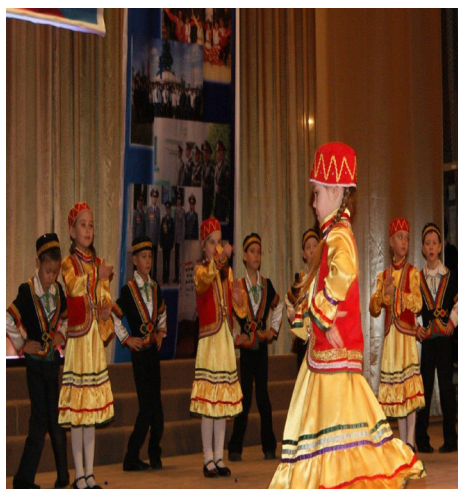
Подготовительная группа НАТ «Эрви»