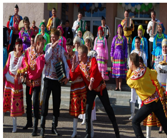
Народные танцы в исполнении НАТ «Эрви»