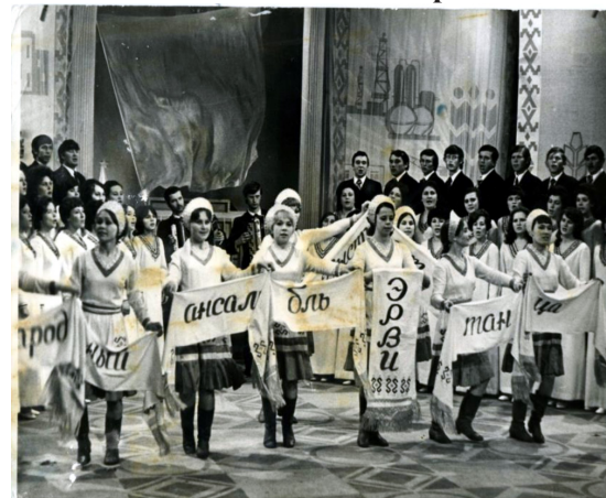
Выступление на Башкирском телевидении 1977 г.