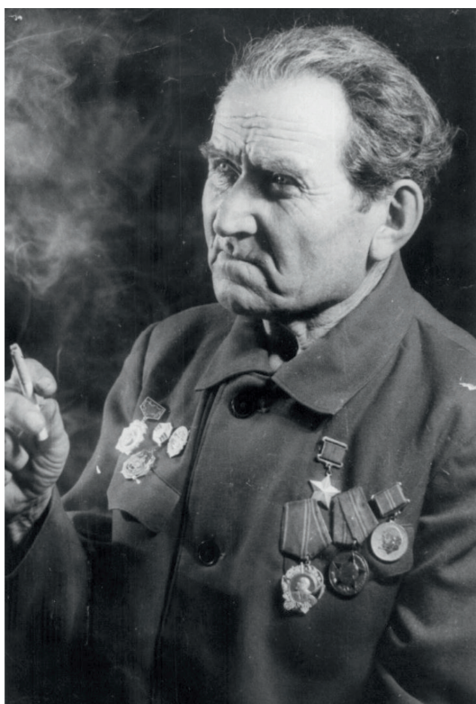
Суслов А.А. Фотография последних лет жизни