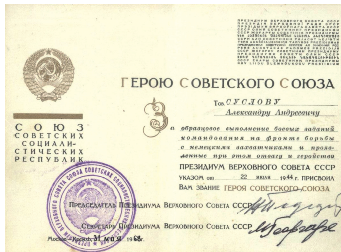
Удостоверение Героя Советского Союза