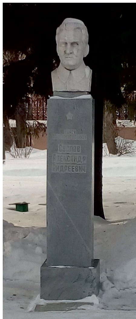
Памятник Герою Советского Союза Суслову А.А у Вечного огня, в центре города Кыштыма