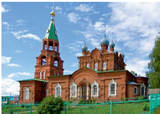
Церковь п. Игра