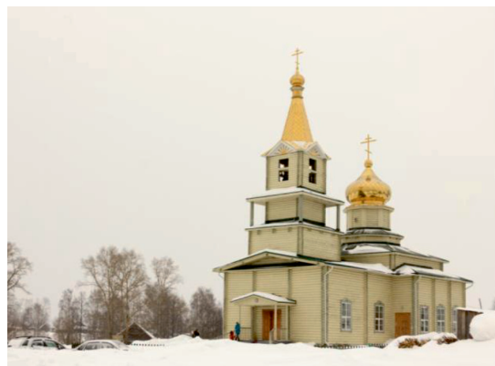
Церковь с. Новые Зятцы