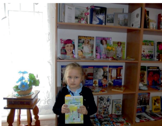
В процессе исследовательской работы: знакомство с книгой «Литературная карта Кунгурского района»