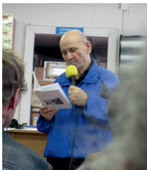
Объект исследования: поэт, писатель, юморист, сатирик – Ф.Н.Липатов