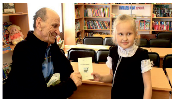
Подарок классу от автора: сборник стихов «Мир природы интересен» (20 марта 2015 г.)