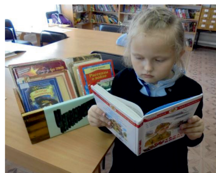
В процессе сбора информации: изучение сборников автора в сельской библиотеке им. Ф.Ф. Павленкова