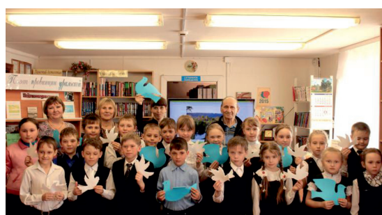
Мы за мир!