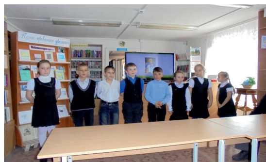
Устный журнал «Поэт провинции уральской» с учащимися 2 и 3 классов