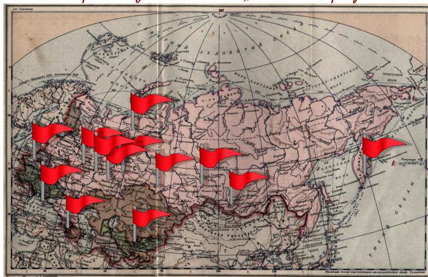
- отметки города, в которых родились, живут и работают члены моей семьи