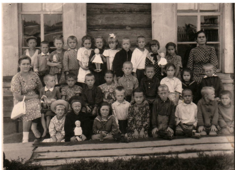
Воспитанники детского дома в г.Буинске МАССР (1948 год)