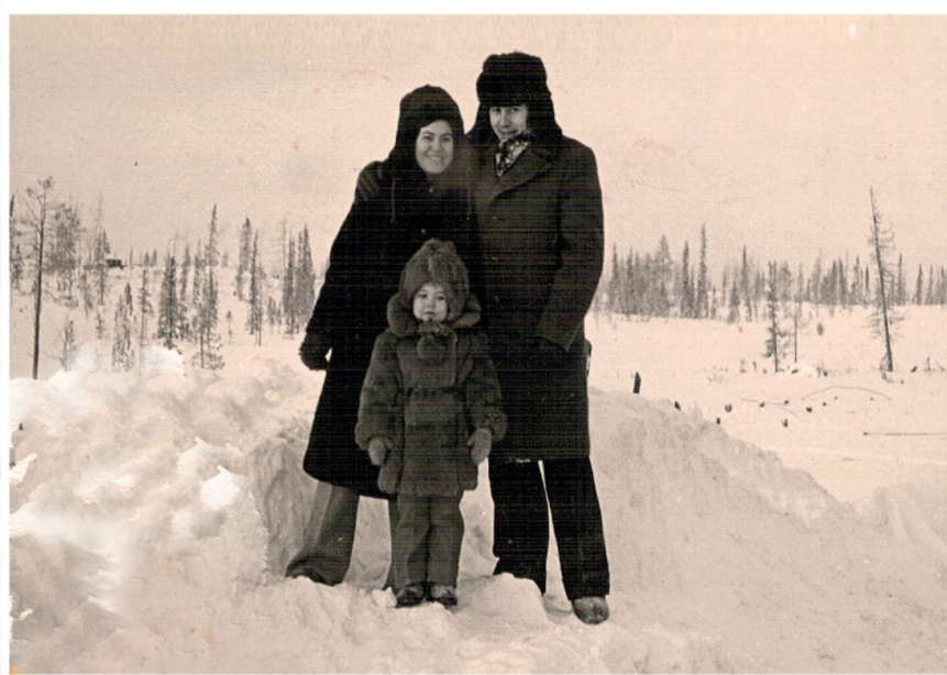
Мои бабушка дедушка и мама в г. Усинске Республики Коми на фоне тундры (1977 год)