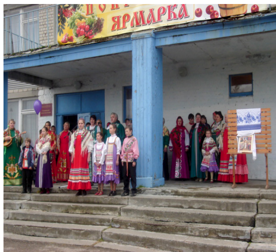
Рис. 5. Покровская ярмарка