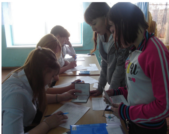
Рис.7 Выборы Президента Совета Старшеклассников