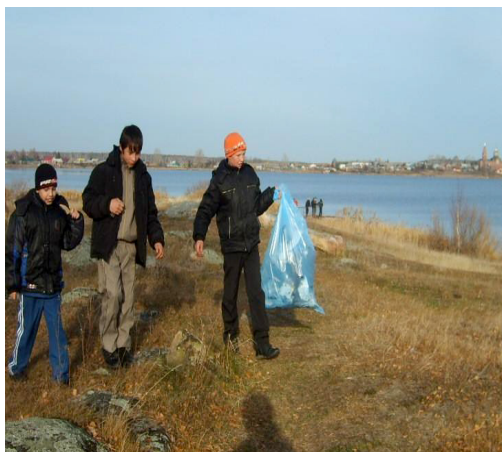
Рис.2 Уборка берега озера от мусора