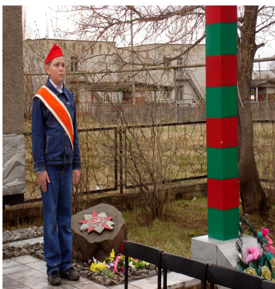
Рис.3 Обелиск в селе – зона нашей заботы!