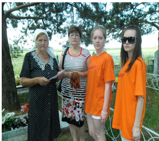
Рис.6 Волонтерский отряд и акция «Георгиевская ленточка»