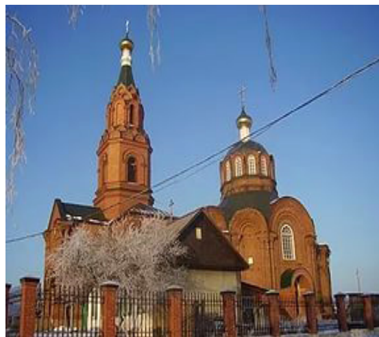
Рис.4 Храм Рождества Христова в с.Сосновском, при котором работает Отряд Православных Следопытов