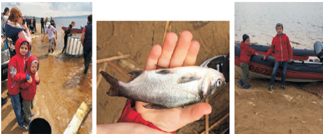
Рис.4. Мероприятия по зарыблению залива р.Волга и оздоровлению экологической обстановки водной зоны, прилегающей к территории пос.Ново-Юдино