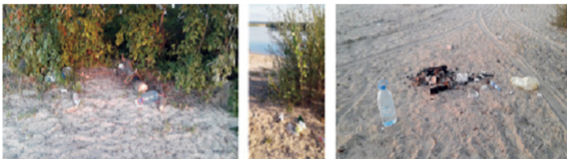
Рис.3. Мероприятия по очистке береговой зоны, прилегающей к территории пос.Ново-Юдино