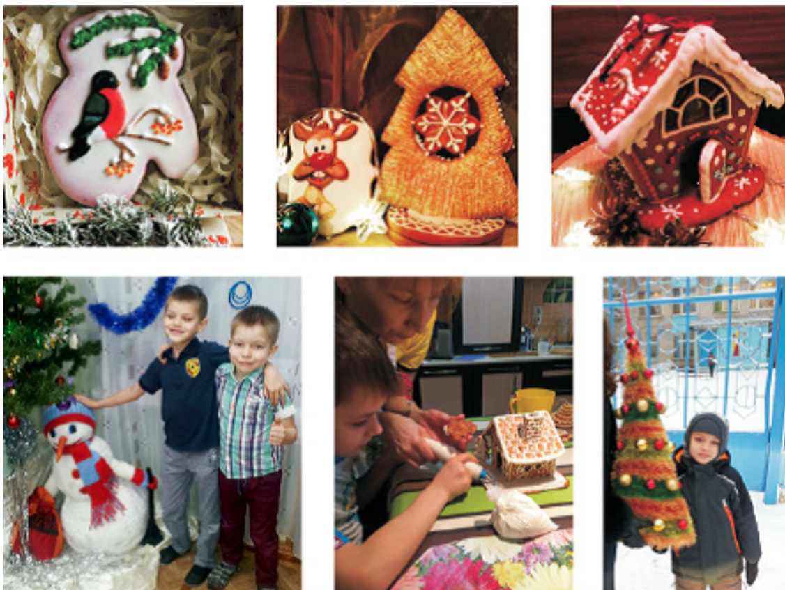
Рис. 7. Декоративно-прикладная деятельность

Данный этап включает в себя подготовку кулинарных поделок для благотворительных акций, художественно-наглядных композиций для уроков окружающего мира, ярких игрушек для друзей младшего возраста.