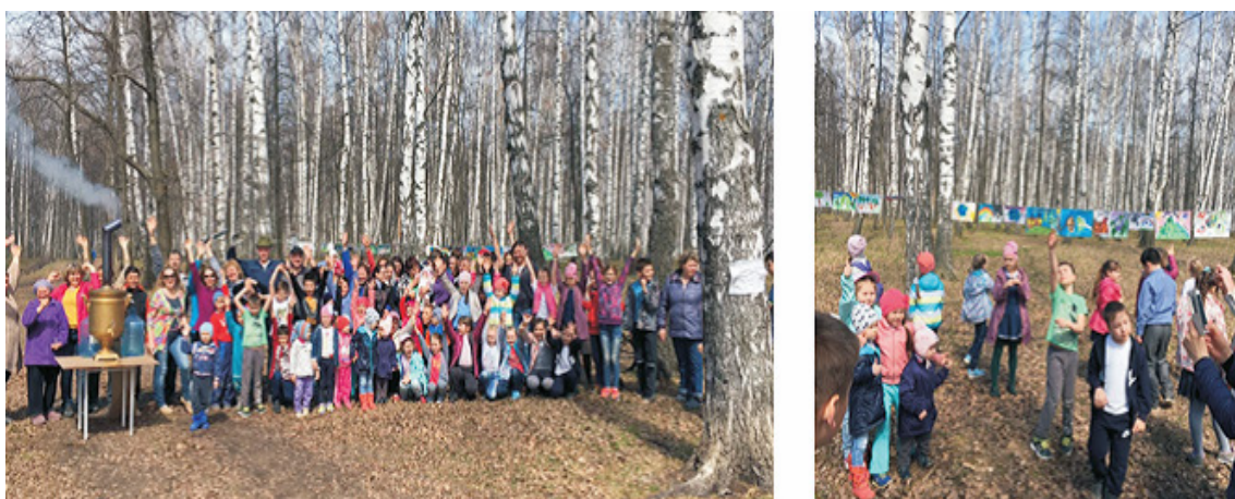
Рис.2. Конкурсы для привлечения детей дошкольного и младшего школьного возраста к работе, связанной с заботой о природе