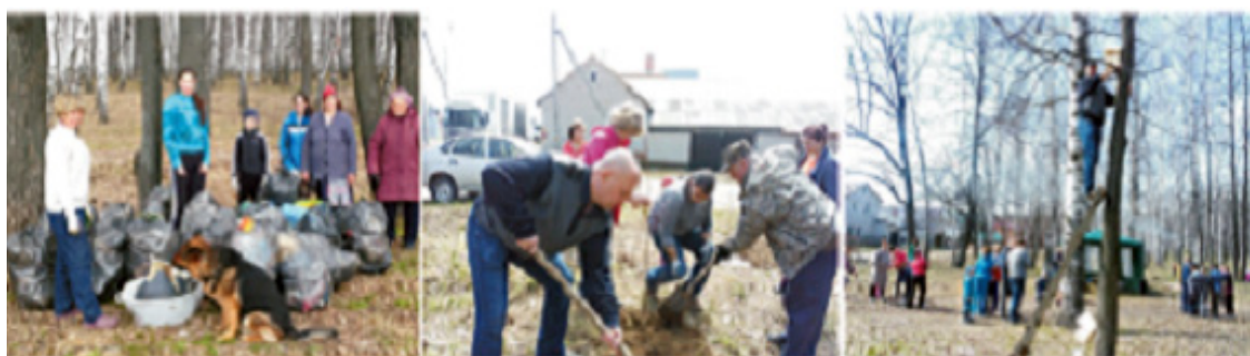
Рис.1. Регулярные субботники по уборке лесной зоны, прилегающей к территории пос.Ново-Юдино

Основная часть данного этапа – это участие в разработке и реализации мероприятий, направленных на улучшение состояния окружающей среды поселка Ново-Юдино.