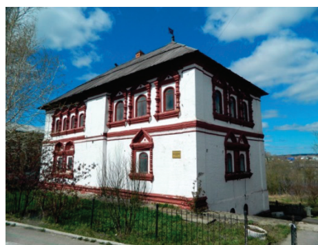
Рис. 16. Дом воеводы, построен в 1688 году. Соликамск