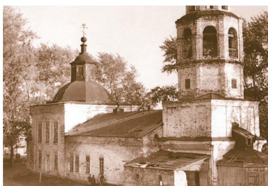
Рис. 8. Церковь Владимирской Божьей матери, с. Новое Усолье, построена в 1757 г. – закрыта в 1951 г.