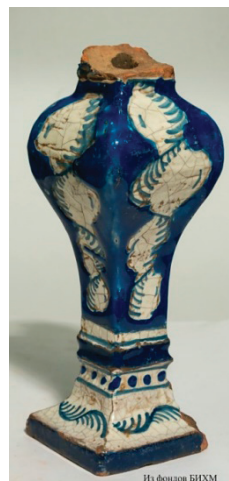
Рис. 15. Балясина от печки голландки из Строгановских палат, конец XVIII в.