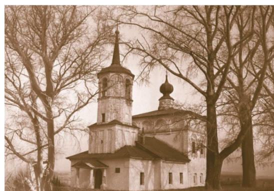
Рис. 10. Никольская церковь, с. Пыскор, построена 1558 гг. – почти полностью разрушена