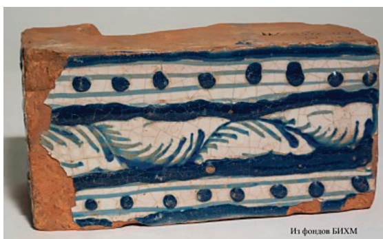
Рис. 13. Изразец бордюрный от печи голландки из с Лёнвинской церкви, XVII в.