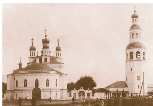
Рис. 4. Спасо-Преображенский собор, с. Новое Усолье, построена 1724–1731 гг. – реставрируется