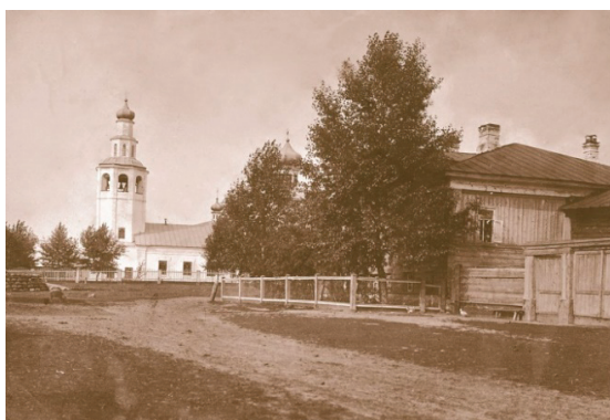
Рис. 7. Церковь Иоанна Предтечи, с. Зырянка, построена в 1757 г. – закрыта в связи с затоплением рудника