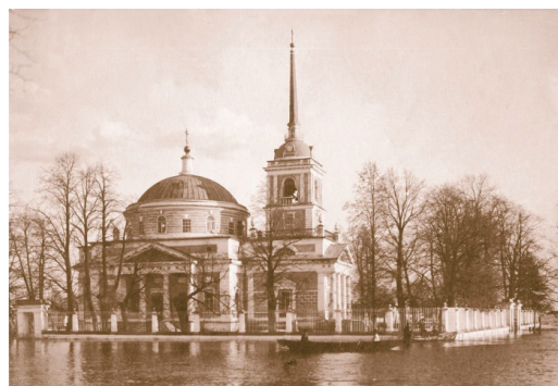
Рис. 5. Никольская церковь, Новое Усолье, построена в 1813–1820 гг. – восстанавливается