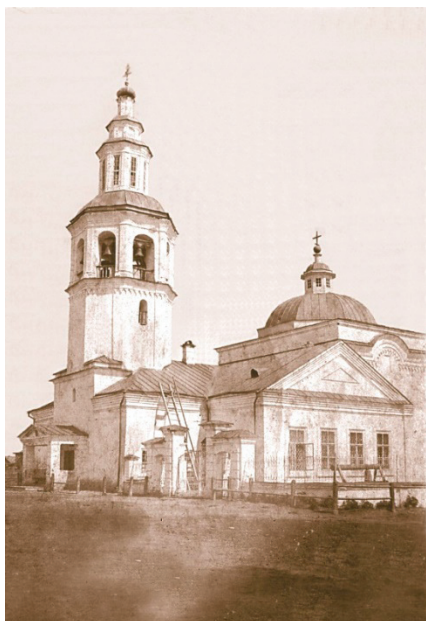
Рис. 6. Свято-Троицкая церковь, Веретия, построена в 1746 г. – разрушена полностью в 1954 г.