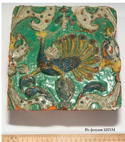
Рис. 12. Изображение павлина на полихромном фасадном изразце Строгановских палат, Усолье, конец XIX в.