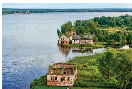
Рис. 11. Зброшенныя постройкі Усоля, матэрыяльны магазін, амбар і дом Абамелек-Лазарева