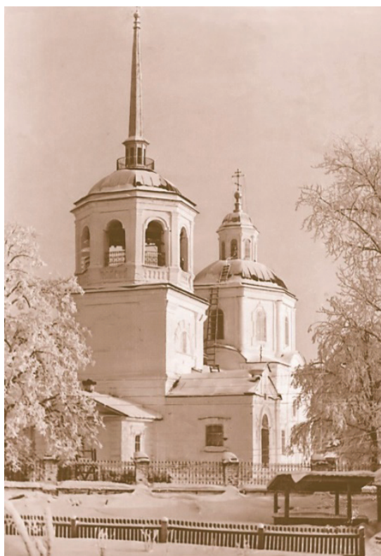
Рис. 3. Церковь Похвалы Богородице, п. Орел, построена в 1735 г. – действующая