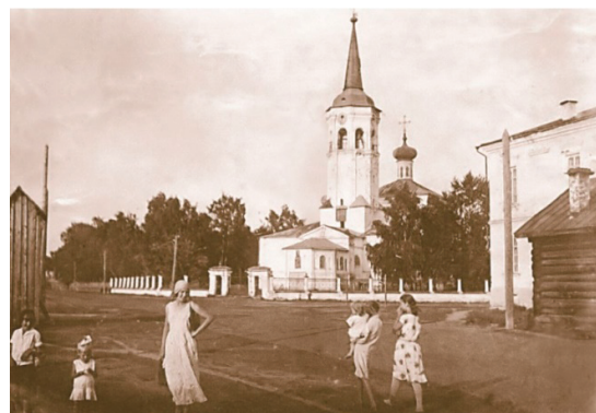
Рис. 9. Христовоздвиженский собор, Дедюхин, построен в 1732 г.- в 1954 г.Взорван, полностью разрушен