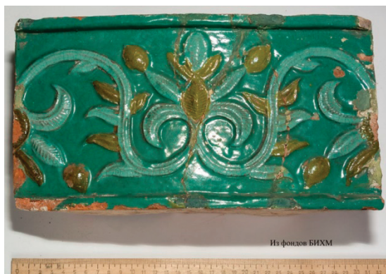
Рис. 14. Изразец с фасада Лёнвинской церкви XVII в.