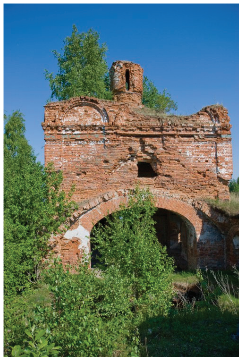
Рис. 2. Свято-Троицкая церковь, с. Лёва, построена в 1687–1688 – в настоящее время почти полностью разрушена