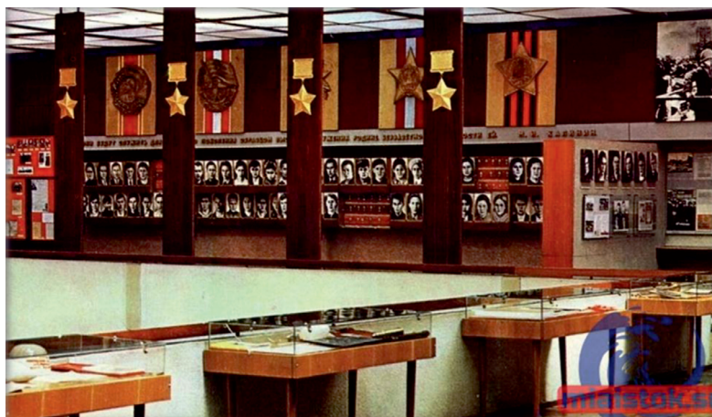
Музей «Молодая гвардия» в городе Краснодоне Луганской области