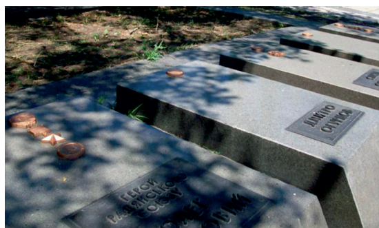
Приложение № 4