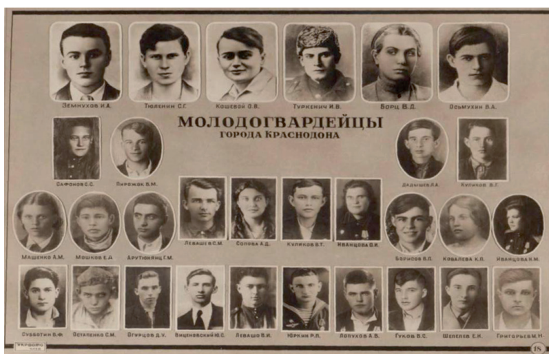
Приложение № 10