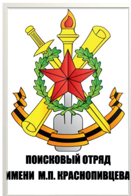
Приложение № 12