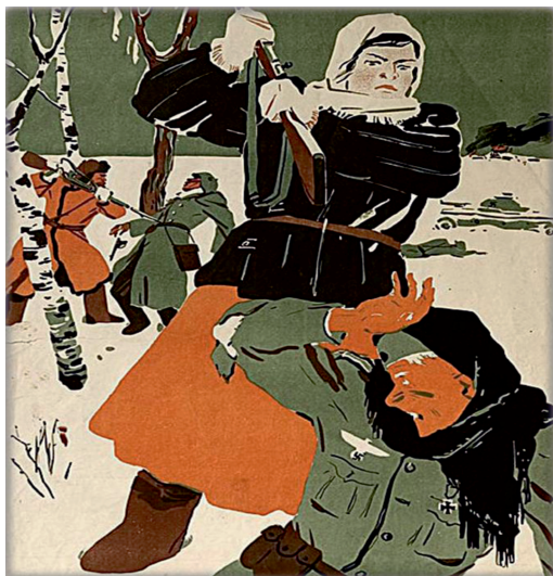
Приложение № 3