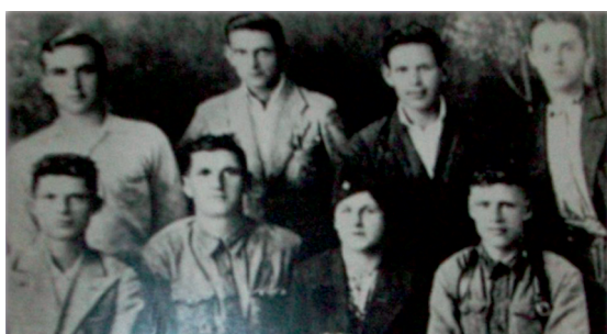
Приложение № 5