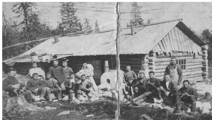
Фото 4. Миньярцы поднимали веками не паханную землю

В маленьком Миньяре, были созданы целых 2 кружка, из которых потом и сформировалась миньярская организация Российской социал-демократической рабочей партии. Благодаря своей активной работе