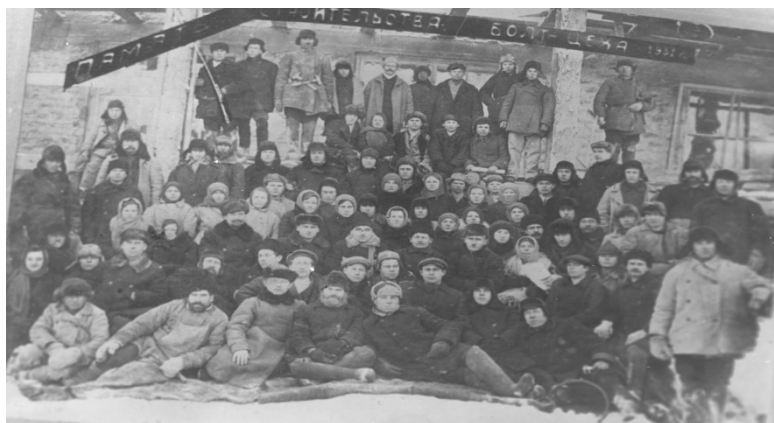
Фото 2. Рабочие железоделательного завода

Специализацией завода было листовое железо – одно из лучших в России, с клеймом «Балашов». Листовое кровельное железо в 1900 году удостоено серебряной медали на промышленной выставке в Петербурге.