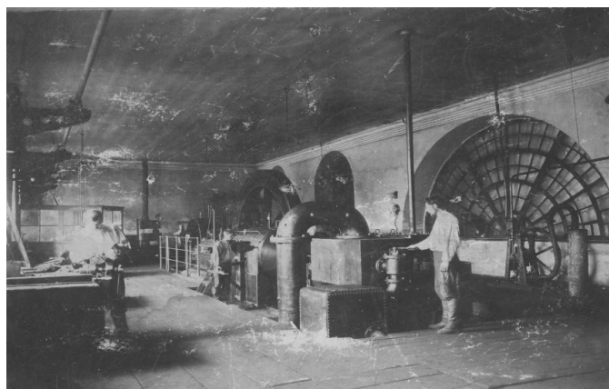
Фото 3. Рабочий цех