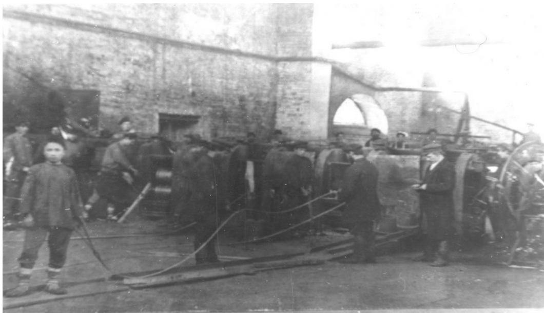
Фото 7. Рабочий цех

Рабочий поселок Миньяр в 1943 году переименован в город Миньяр.