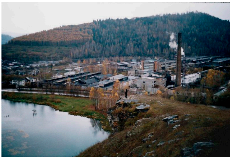
Фото 8. Миньяр Город-Завод

Если просто перечислить наименование цехов завода можно понять, какой это был завод: холоднопрокатный цех; горячепрокатный цех; сталепроволочный цех; прокатно-термический цех; энергетический цех; железнодорожный цех; электроремонтный цех; цех водоснабжения и канализации; ремонтно-механический цех; инструментальный цех; центральная заводская лаборатория; ремонтно-строительный цех; отдел технического контроля; жилищно-коммунальный отдел; цех ширпотреба (цех производства продукции широкого потребления).