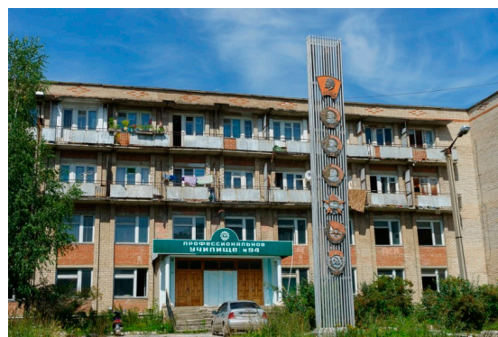
Фото 9. Профессиональное училище и памятник комсомольцам

Особенностью Миньярского метизно-металлургического завода являлось то, что оборудование завода позволяло выпускать