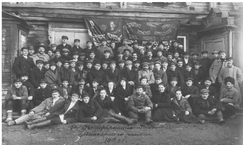
Фото 5. Делегаты конференции

В феврале 1917 года большевистская организация вышла из подполья, был избран Совет рабочих депутатов, который принял