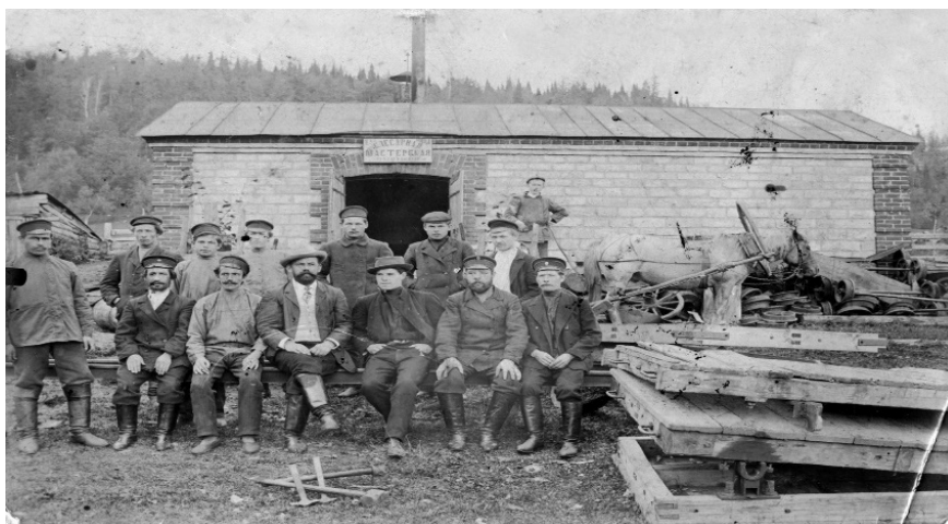
Фото 1. Мастерская

Город Миньяр имеет более чем 230-летнюю историю. Железодельный завод бывшей Уфимской губернии возник в 1734 году у слияния двух горных рек. Высокая плотина, загородившая реки Сим и Миньяр, служила движущей силой механизмам. Прокатный 3-х валковый стан был пущен в 1856 году. Одновременно действовали пудлинговые печи.