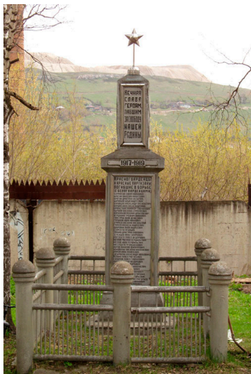
Фото 6. Памятник революционерам

решение о 8-часовом рабочем дне во всех цехах завода. Была организована рабочая милиция. А в июле 1917 г. был создан первый Союз социалистической рабочей молодежи на Южном Урале.