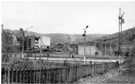
Фото 12. 30 лет назад был подписан акт готовности спортивного корпуса

Первые конкурсы, проходящие сегодня под названием «Играй гармонь» проводились в Миньяре, как «гармонь Уральская».