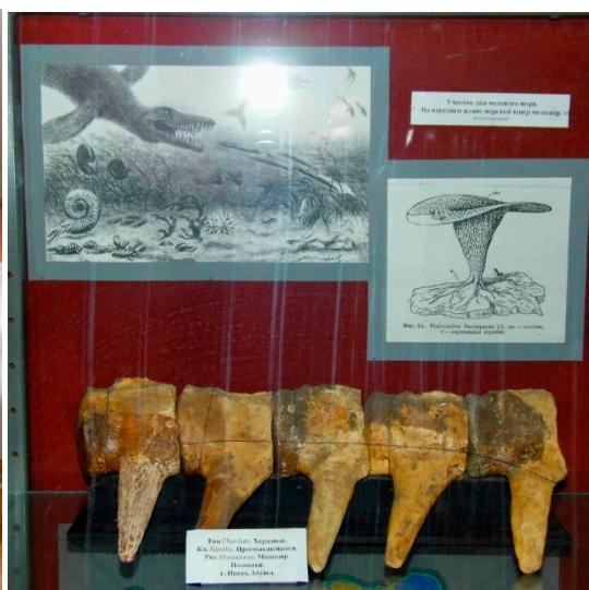
Фото с экспозиции выставки