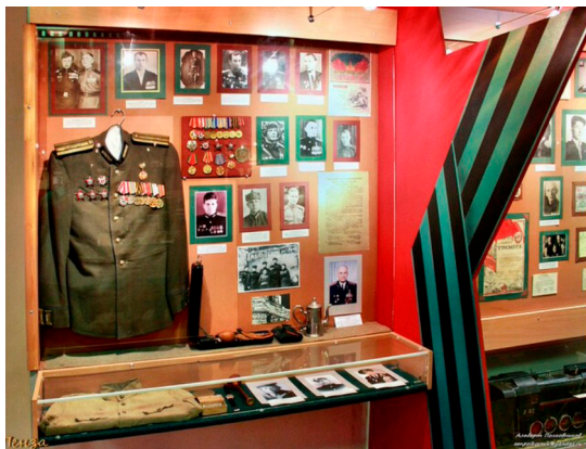
Фото с экспозиции выставки

Во время экскурсии мы ознакомились с фактами из времен Первой и Второй мировых войн, а также войны в Афганистане и в Чечне. Я с интересом разглядывал макеты военной техники и оружие, знамена воинских соединений, награды, уникальные фотографии.