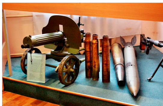
Фото с экспозиции выставки

в ратной истории нашего государства, их храбрость и самоотверженность, героизм при выполнении воинского долга.