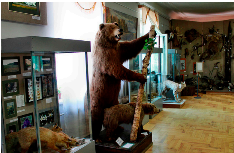
Фото с экспозиции выставки

На экспозиции выставки уделено большое внимание вопросам изучения и охраны природы в Пензенской области, организации заповедников и создания Красных книг редких и исчезающих растений и животных.