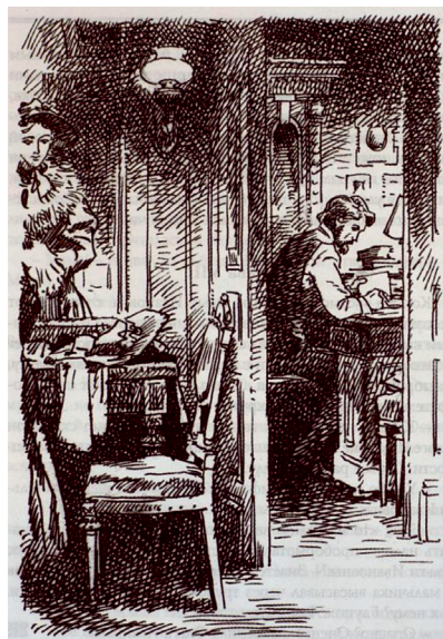
Иллюстрация к рассказу А.П. Чехова «Попрыгунья»

Портрет писателя Антон Павловича Чехова. 1898 г.