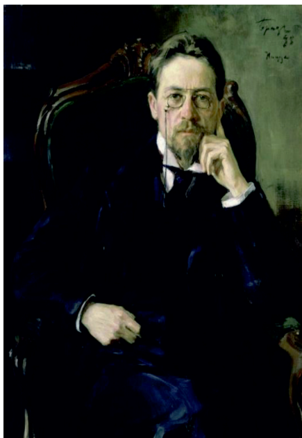
Браз Иосиф Эммануилович (1873-1936)

Портрет писателя Антон Павловича Чехова. 1898 г.