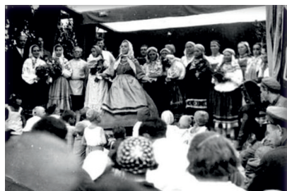
Хор пел в госпиталях и перед рабочими заводам