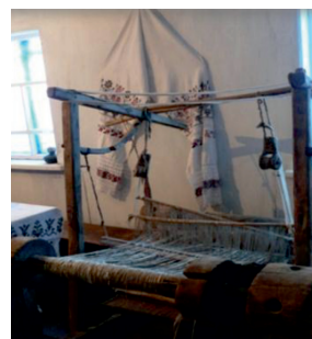
Музей русской песни