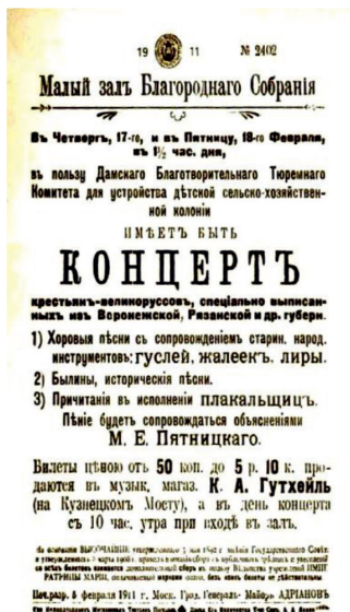
Такая афиша появилась в Москве в 1911 году