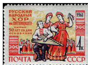
Почтовая марка СССР (1961)