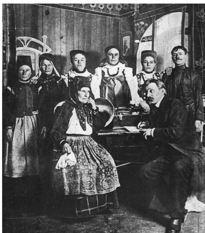
Хористы первого хора Пятницкаго