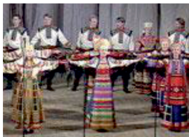
Хор им. Пятницкаго сегодня