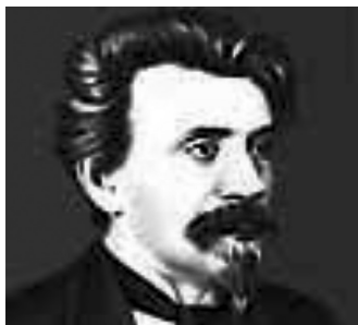
Митрофан Ефимович Пятницкий (1864–1927 гг.)