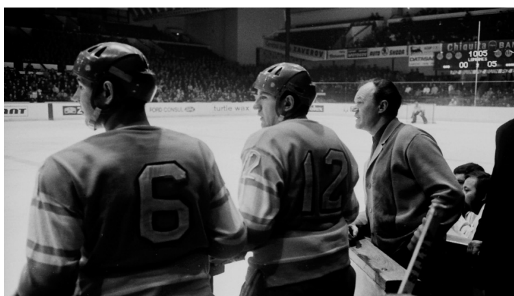
Советские хоккеисты под руководством Всеволода Боброва

Многие спорят, как же это произошло, и ругают наших игроков. А я думаю, просто раньше в СССР главный мотив к победе был – очень жесткая дисциплина, а как же иначе в то время? И поэтому сборная команда СССР так прекрасно и сильнее всех играла. А сейчас нет такой жестокой дисциплины. Хоккеисты должны сами хотеть тре-