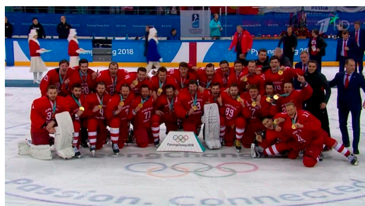
Сборная России по хоккею – обладатели золота Олимпийских игр в Пхенчхане в 2018 году

Швеция выиграла этот чемпионат. Мы не огорчались и в итоге добились золота на Олимпийских играх 2018 в Пхенчхане.