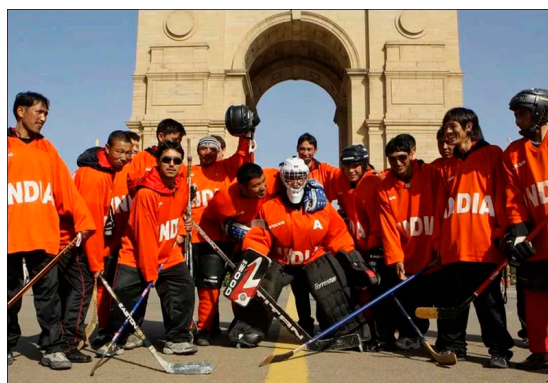
Хоккеисты из Индии

Современный хоккей с шайбой как спортивная игра возник в середине 19 века в Канаде. Это страна, климат и природа которой (многочисленные водоемы, замерзающие зимой, и длительные зимы) создавали хорошие условия для распространения этой игры. Сначала играли не шайбой, а тяжелым мячом и по численности команды доходили до 50 и более игроков с каждой стороны.