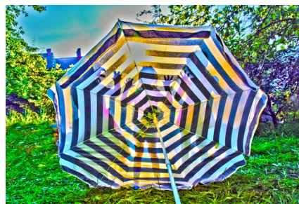
Рис. 4. Театр теней на свежем воздухе