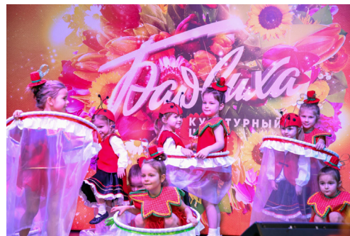
Рис. 3. Театр современного танца