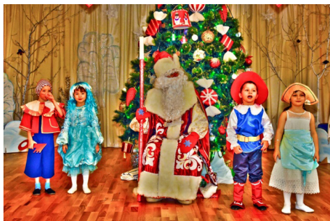
Рис. 1. Новогодний театр. Первое выступление