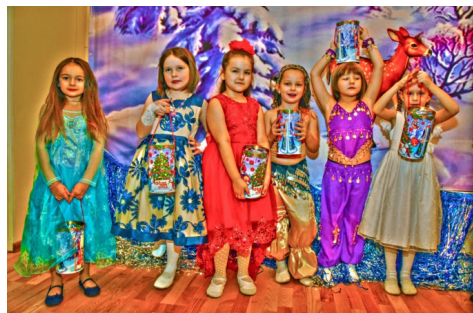
Рис. 2. Мюзикл «Щелкунчик»