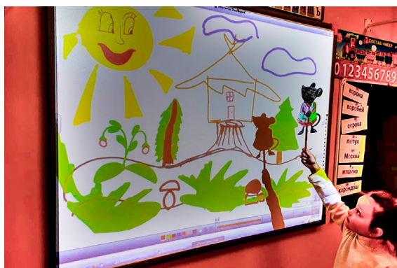
Рис. 5. Театр теней в школе