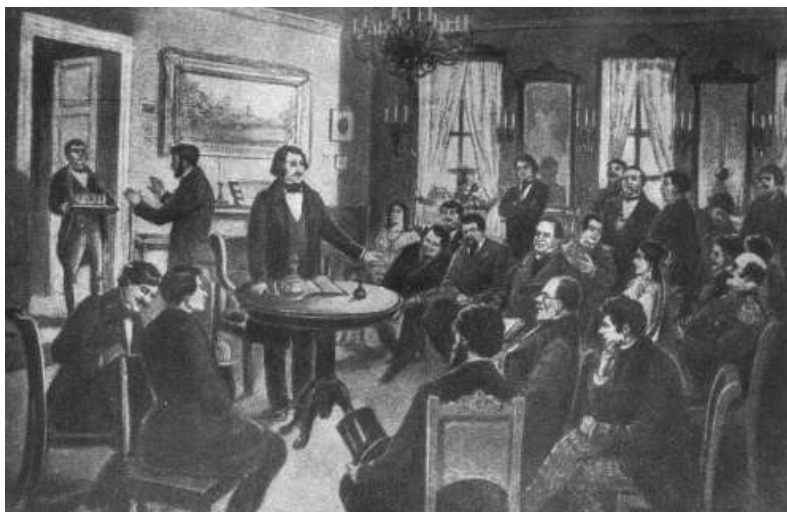
Гоголь читает «Ревизор»