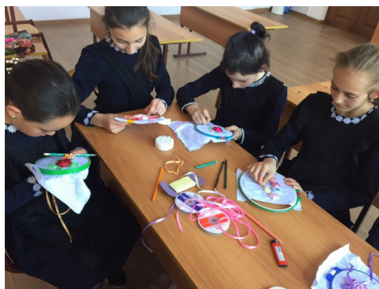
Приложение 5 Работы учеников школы с. Фарн