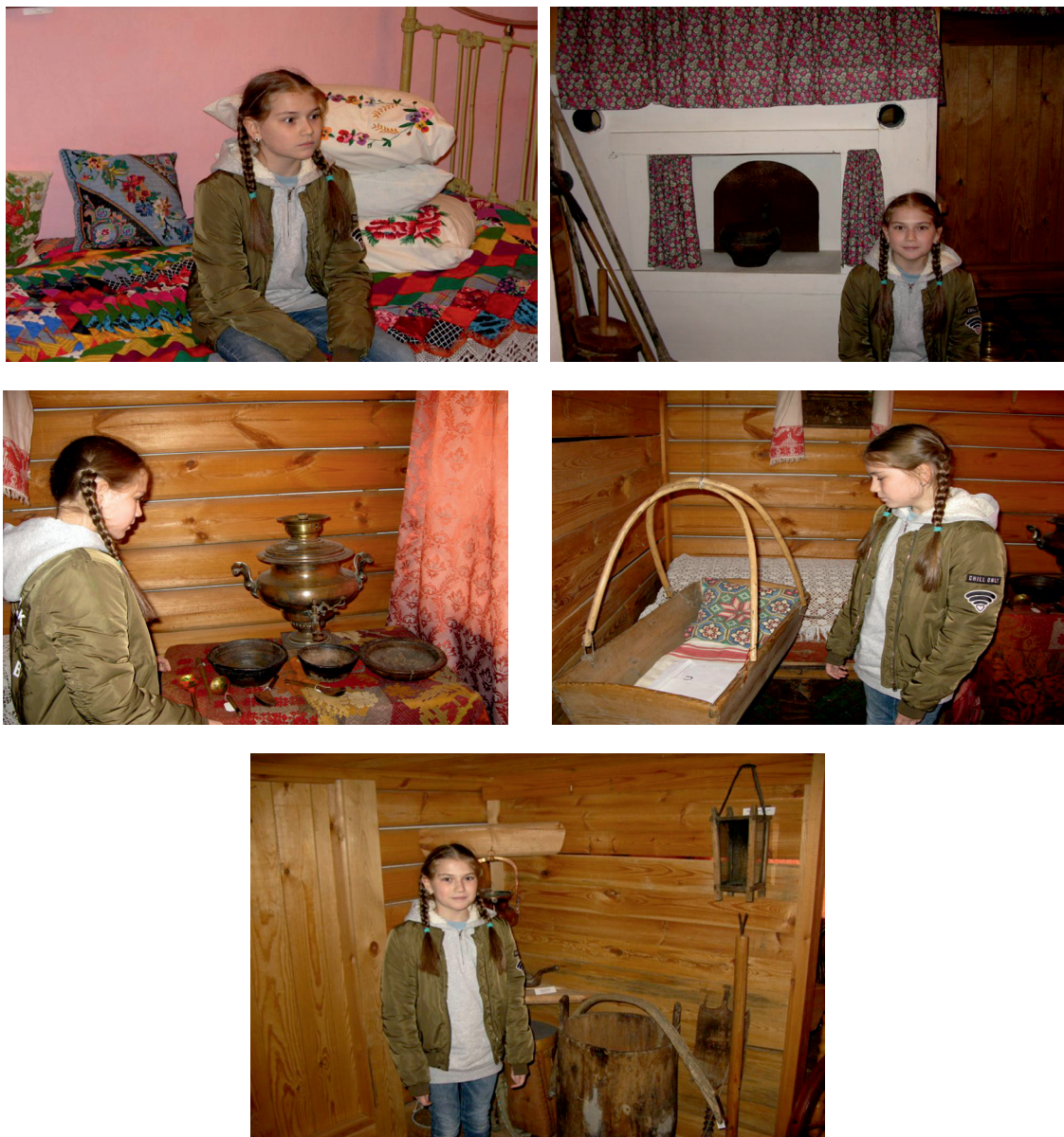
Фото 1.8. Убранство дома старообрядцев