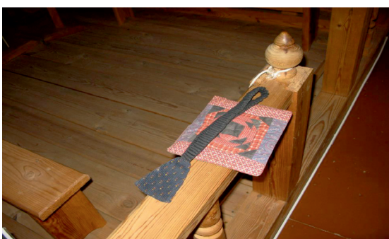
Фото 1.5. Лестовка