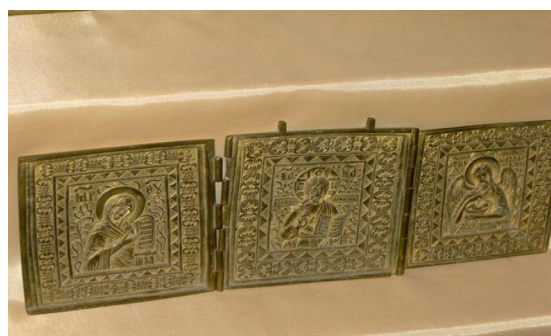
Фото 1.6. Старообрядческие иконы