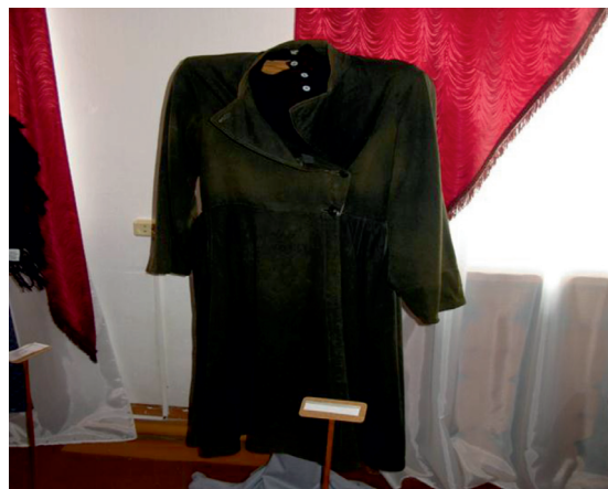
Фото 1.2. Мужская одежда старообрядцев