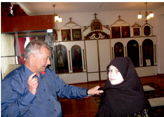
Фото 1.4. Обязательный атрибут женского костюма – платок