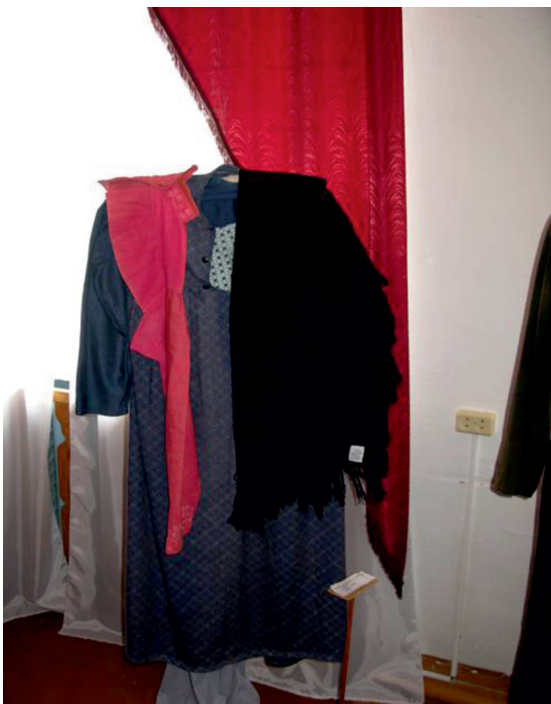
Фото 1.3 Женская одежда старообрядцев