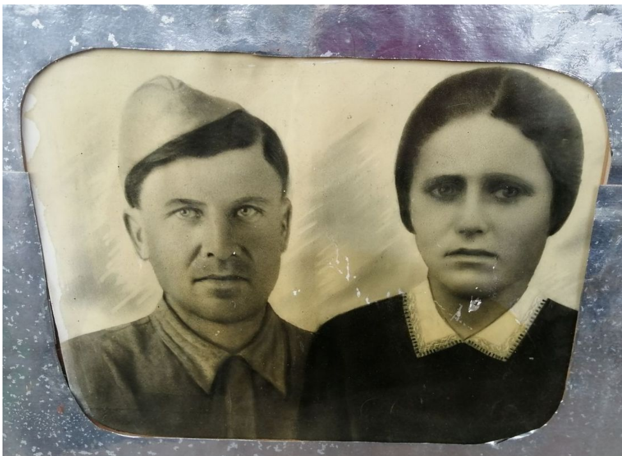
Рис. 2 - Прапрадедушка с прапрабабушкой