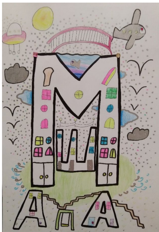
Рис.5 «Композиция из букв»

Один раз в неделю я посещаю факультативный курс «Пишу красиво» в МАОУ «Гимназия №6» г.Перми, где я получаю знания и навыки правильного письма (рис. 4).