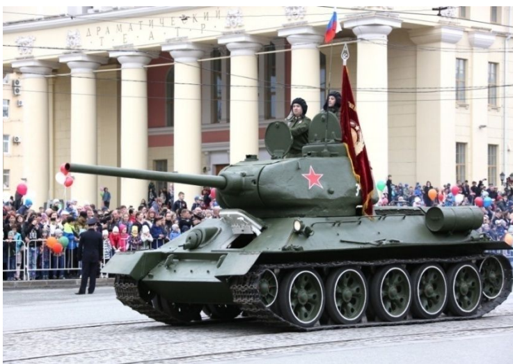
РИСУНОК 1. ПАРАД 9 МАЯ В Г. НИЖНИЙ ТАГИЛ [5].

Каждый год в нашем городе проходит Парад, посвященный Дню Победы в Великой Отечественной войне.