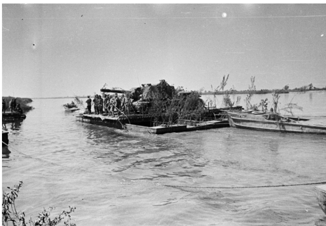
РИСУНОК 7. ФОРСИРОВАНИЕ ВИСЛЫ [16].

В ходе Висло-Одерской операции от немецких войск была освобождена территория Польши к западу от Вислы и захвачен плацдарм на левом берегу Одера, использованный впоследствии при наступлении на Берлин. Операция но-