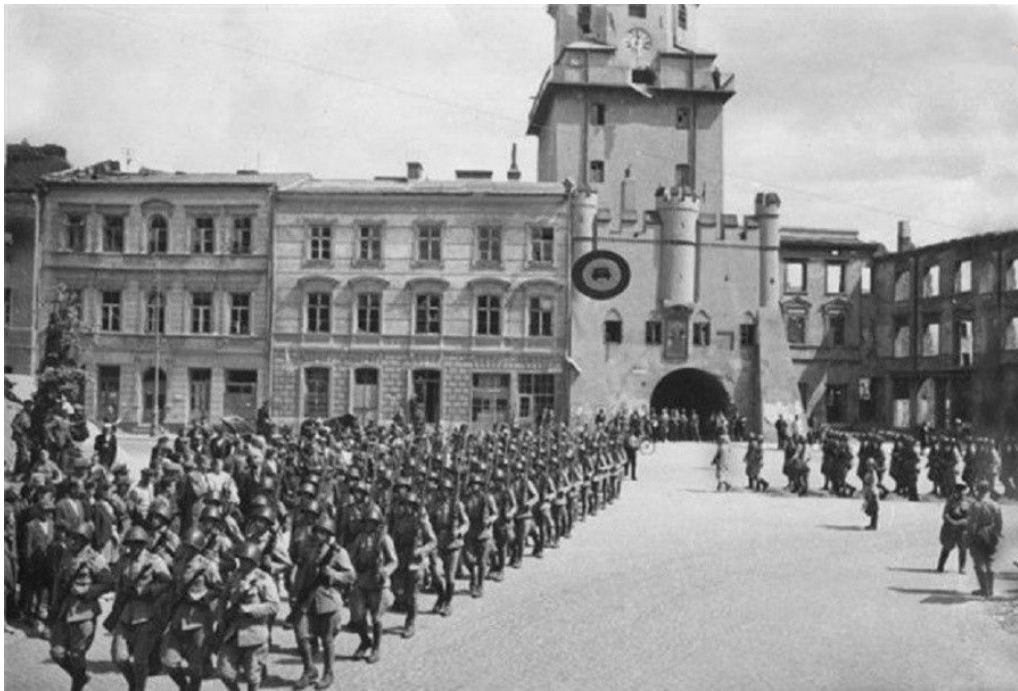
РИСУНОК 5. ПОЛЬСКИЙ ГОРОД ЛЮБЛИН ВО ВРЕМЯ ВТОРОЙ МИРОВОЙ ВОЙНЫ [10].

Люблин-Брестская наступательная операция была проведена войсками 1-го Белорусского фронта с целью разгрома брестской и люблинской группировок противника. С немецкой стороны им противостояли соединения 2-й армии и 9-й армии группы армий «Центр» и 4-я танковая армия группы армий «Северная Украина».