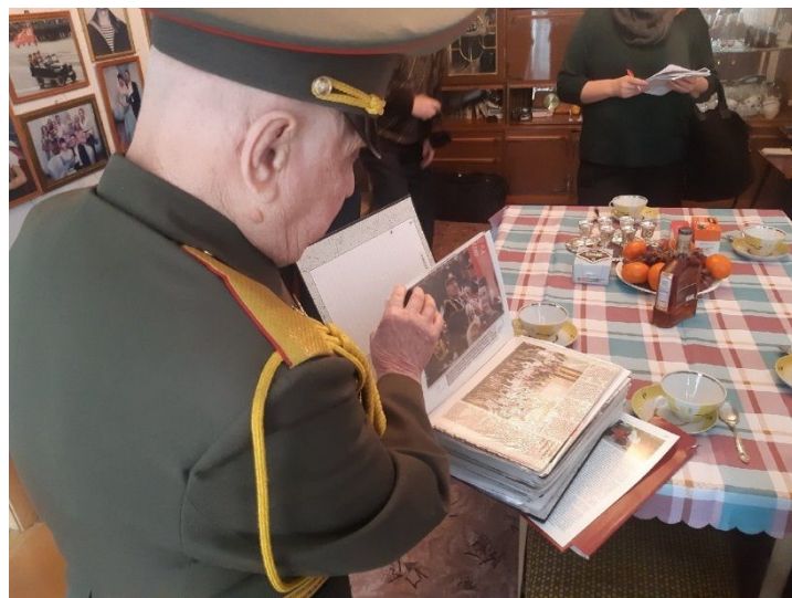
РИСУНОК 9. В ГОСТЯХ У А. В. ФЕДИНА.