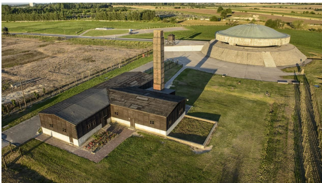
РИСУНОК 6. КОНЦЕНТРАЦИОННЫЙ ЛАГЕРЬ МАЙДАНЕК [13].

Концлагерь, созданный фашистами 20.07.1941 года как трудовой, стал настоящей фабрикой смерти. За время существования в лагере побывало 150 тысяч заключённых, из которых 80 тысяч казнили.