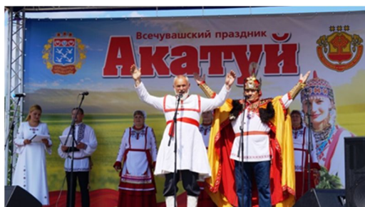
Рис. 5. Праздник «Акатуй»

Вывод: Активное межэтническое взаимодействие чувашей с разными народами продолжается и в наши дни. Оно протекает в условиях постепенной трансформации традиционных обрядов.