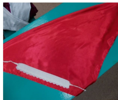
Рис. 3. Фатка и Рубаха