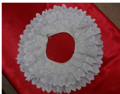
Рис. 4. Хомут