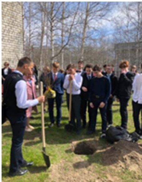
Акция «Посади дерево»

позапрошлом году в день последнего звонка мы всем классом сажали сирень на школьном дворе, и она прижилась! Время летит неумолимо, и вот-вот к нам постучится последний школьный май. И мы, выпускники, обязательно посадим еще саженцы во дворе родной школы.