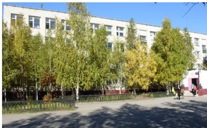
МБОУ «СШ №12»

Юрия Константиновича («Космические братья»), Кантора Максима Карловича («Чернобыль. Звезда Полюнь»), составляющих фонд Государственной Третьяковской галереи.