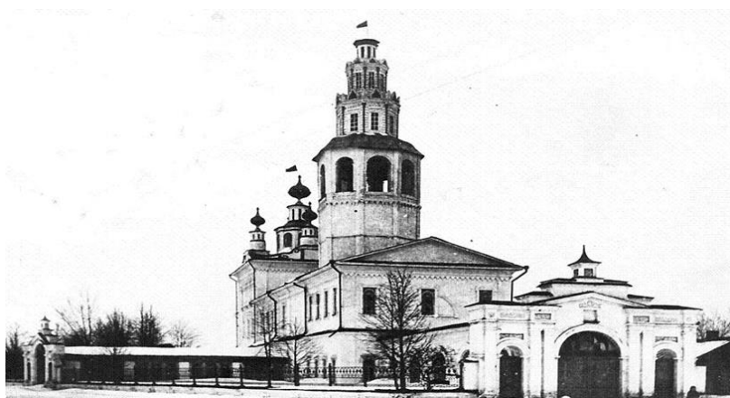
Рис. 3. Церковь Преображения Господня.