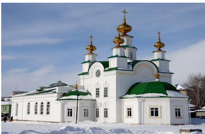
Рис. 2. Успенский храм в настоящее время.

В 1750 году на берегу Сылвы был заложен Успенский храм. Храм был увенчан пятью главами. Успенский храм действовал 180 лет. В 1935 году в октябре храм закрыли. Многие годы в стенах его располагалась детская спортивная школа. В настоящее время церковь передана верующим, и началось ее восстановление [5].(Рис. 2).