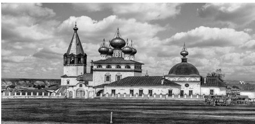
Рис. 1. Благовещенский собор.

Церковь во имя святой великомученицы Параскевы Пятницы, ровесница города, построена на каменистом возвышенном мысу (где сейчас городская площадь). Только через тридцать с лишним лет, при Петре Великом, с благословения архиепископа Ионы приступили к постройке Благовещенского собора – первый каменный храм в городе. Новый Благовещенский собор был холодным, теплый же собор был построен позднее в 1740 году, рядом с Благовещенским холодным храмом на месте снесенной Параскевинской церкви. Эти два храма стоявшие рядом составляли ансамбль, впоследствии получивший наименование «Соборный»[2, с.23]. (Рис. 1).