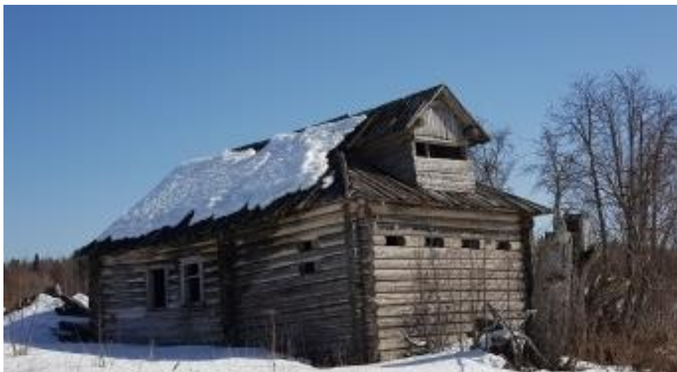
Рисунок 2. Сохранившийся блокгауз в д. Большие Озерки

Онеги, по прибытию подать сигнальные ракеты. «В 5 часов утра мы вышли в 3 км на тракт. Известить не получилось. В лагере противника подняли тревогу, противник допустил нас до 1000 шагов и открыл ураганный и ружейный огонь, целый день шёл бой. Кончились пулеметные ленты. Огонь противника нанес исключительно большое поражение. Два других батальона так и не вышли на связь и отступили. Остался один батальон с ранеными. Выставили сторожевую охрану и расположились в избушках на отдых. Дальнейший непрекращающийся артиллерийский огонь по деревне вынудил уйти из нее в лес» [5]. Из воспоминаний рядового Антипина И. из 2-го Московского полка: «К Озеркам шли 2 суток, подошли утром... Подход к селениям предстоял через мост, другого подхода не было найдено. Мост этот был пристрелен из пулеметов белогвардейцев и англичан, установленных в хатах селений (рис. 2) и попытка нашей разведки перейти мост кончилась неудачей и потерями. Тогда командир полка тов. Соколов приказал подавить пулеметы огнем артиллерии. Были установлены 3-х дюймовки и открыт огонь по хатам, из которых стреляли пулеметы. После нескольких удачных выстрелов белогвардейцы и англичане выскакивали из хат и ударились наутек. Проход через мост был свободен» [2].