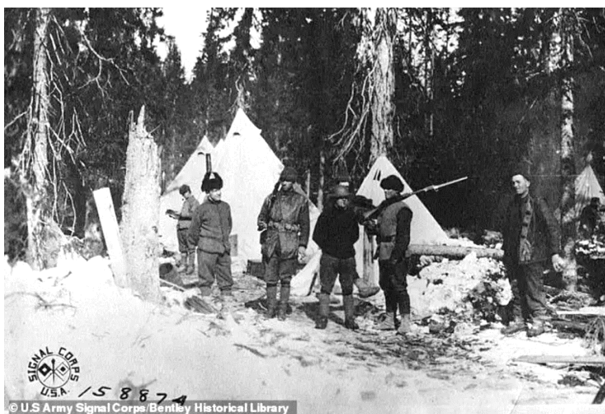
Рисунок 3. Инженерная рота С армии США у Больших Озерков

18 марта отряд 339-го пехотного полка армии США пытался подойти к Б. Озеркам с запада, но в одной версте от селения был обстрелян из пулемётов. 19 марта интервенты опять произвели попытку наступления на занятую деревню, но были обращены в бегство. Между 20 и 22 марта к американцам присоединились две британские роты 6-го батальона Собственного принцессы Уэльской Йоркширского полка и уникальная рота С 310 инженерного полка войск США (рис. 3). Союзники построили ряд деревянных срубов, бревенчатых заграждений и укрытий для войск на участке примерно в 4 милях к востоку от села по дороге на Обозерскую, которая находилась в 12 милях восточнее.