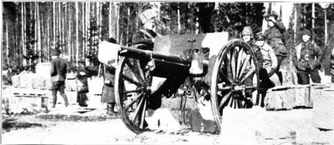
Рисунок 4. 75-мм орудие артдивизиона армии Северной области

1 апреля в 8 часов была предпринята третья атака, но и она была отбита. Силами артиллерии и авиации достигнут перелом. Войска красных не выдержали артогня и отошли к Большим Озеркам. Солодухин собрал в них оставшихся бойцов и удерживал деревню, пока оставалась надежда перехватить инициативу. Но противник также не торопился воспользоваться изменением обстановки в свою пользу [7].