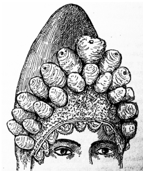
Рисунок 1. Однорогий кокошник Псковского уезда с шишками

очельем и плоским округлым верхом [6]. В костюмах центральной части России часто используются цветные камни в металлической оправе, вышивка золотыми нитями, бисером и жемчугом в качестве украшений. Такие головные уборы можно встретить в национальных костюмах Нижегородской, Костромской, Ярославской, Московской, Владимирской, Вологодской, Казанской, Вятской и Пермской губерний, на прилегающих к ним территориях.