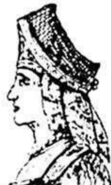
Рисунок 4. Кокешник Дмитровского уезда Московской губернии, 1850 г.

В течение истории интерес к кокошникам менялся волнообразно. После того, как император Петр I запретил старый костюм, кокошник, как и весь костюм в целом, стал запрещенным в высшем обществе. Его носили только крестьяне, купцы и мещане. Возрождение интереса к этому головному убору произошло только во времена правления Екатерины II, которая ввела так называемое «русское платье» для придворных, выделяя себя из-под влияния Елизаветы Петровны. Екатерина II также проявляла интерес к национальным традициям в своем собственном образе (Рисунок 5) [8].