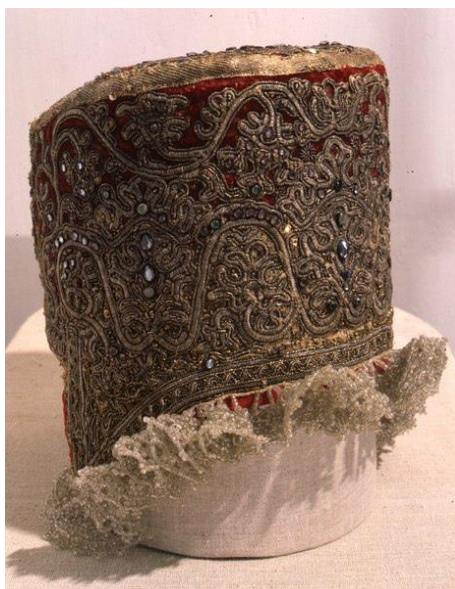
Рисунок 2. Кокошник в виде цилиндрической шапки.