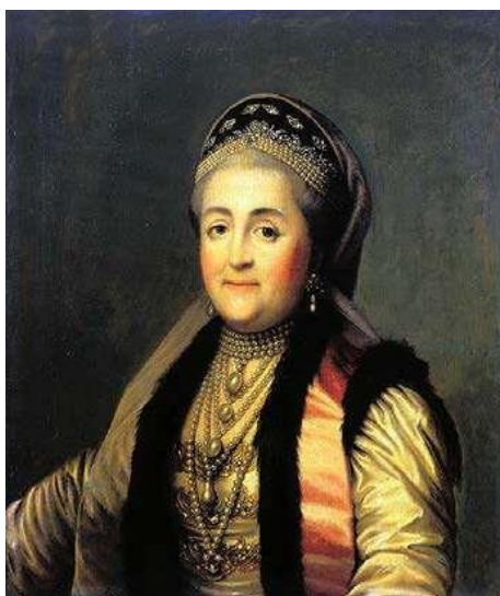
Рисунок 5. Виргилиус Эриксен (1769-1772). Портрет Екатерины II в шугае и кокошнике. Холст, масло. Государственный Эрмитаж, Санкт-Петербург

В течение истории интерес к кокошникам менялся волнообразно. После того, как император Петр I запретил старый костюм, кокошник, как и весь костюм в целом, стал запрещенным в высшем обществе. Его носили только крестьяне, купцы и мещане. Возрождение интереса к этому головному убору произошло только во времена правления Екатерины II, которая ввела так называемое «русское платье» для придворных, выделяя себя из-под влияния Елизаветы Петровны. Екатерина II также проявляла интерес к национальным традициям в своем собственном образе (Рисунок 5) [8].