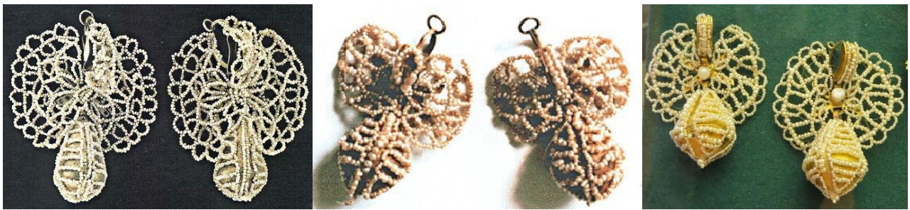
Рисунок 1. Музейные образцы серег-бабочек [3]

матери к дочери как большая драгоценность. Изготавливали серьги сами крестьяне. По размеру и форме их старались подобрать и к лицу, и к силуэту убора. Тем не менее, общая стилистическая основа серег Олонецкой губернии оставалась одинаковой. Серьги напоминали бабочек с ажурными крылышками и грушевидной подвеской. Отсюда произошло название: «серьги-бабочки» (Рисунок 1).