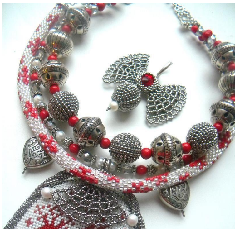
Рисунок 2. Современный вариант использования традиционного изделия