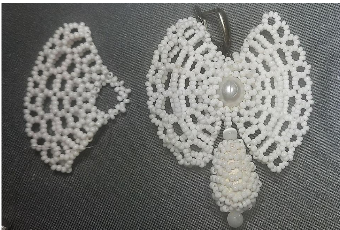
Рисунок 4. Реплика музейного экспоната

Я научилась плести серьги из бисера, узнала много нового о русском народном творчестве и традициях. Мои серьги получились очень красивыми и оригинальными (Рисунок 4). Я надеюсь, что они понравятся не только мне, но и окружающим и вдохновят кого-нибудь также заняться бисероплетением.