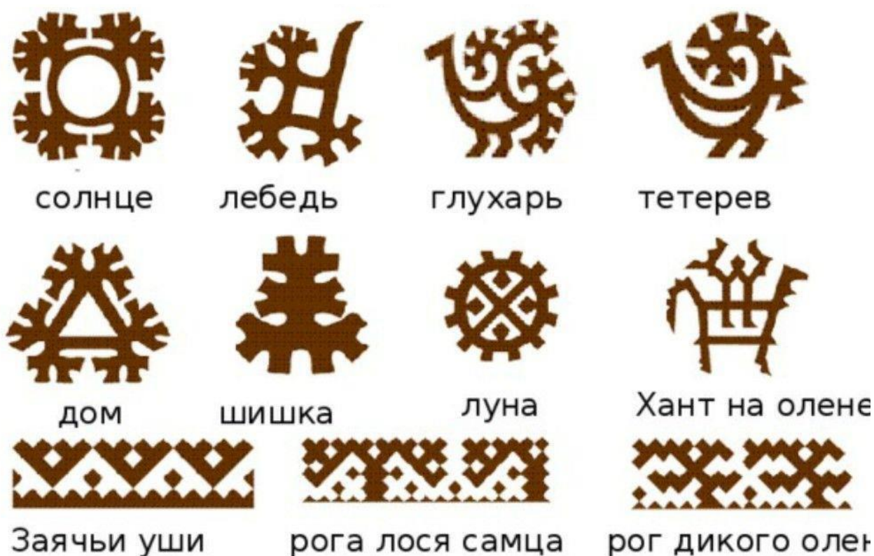
Рисунок 1. Хантыйские орнаменты