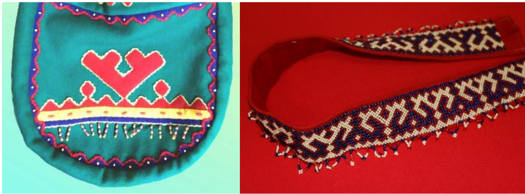
Рисунок 2. Бисерные работы