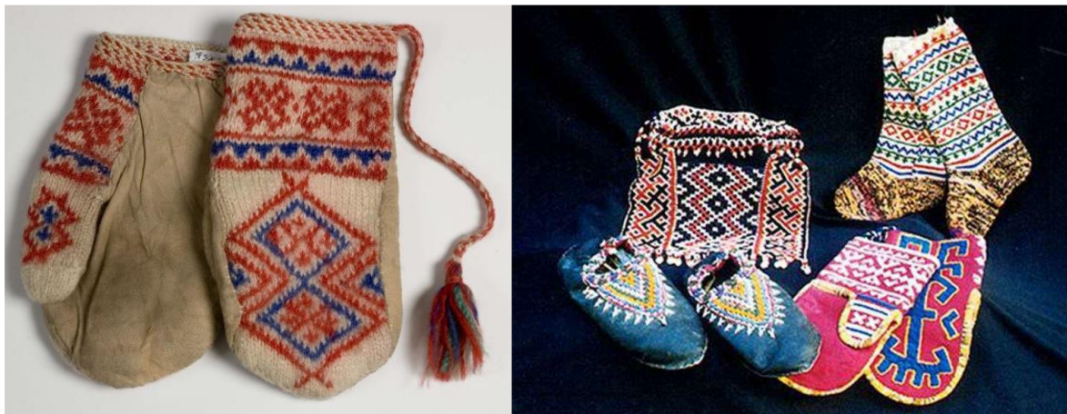
Рисунок 3. Шерстяные изделия с узорами

Одним из немногих женских занятий ханты, которые сохранились до сих пор, является узорное вязание из шерсти. В основном, вяжут теплые варежки. Хантыйские орнаменты для них очень подходят. Каждой мастерице с детства знакомы основные рисунки, которые она сама корректирует во время вязания. Мотивы на варежках имеют столь же много значений, как и в других видах рукоделия. Иногда узоры также используются для вязания носков. Мастерицы знают, что важно при вязании не оставить орнамент неоконченным (Рисунок 3).