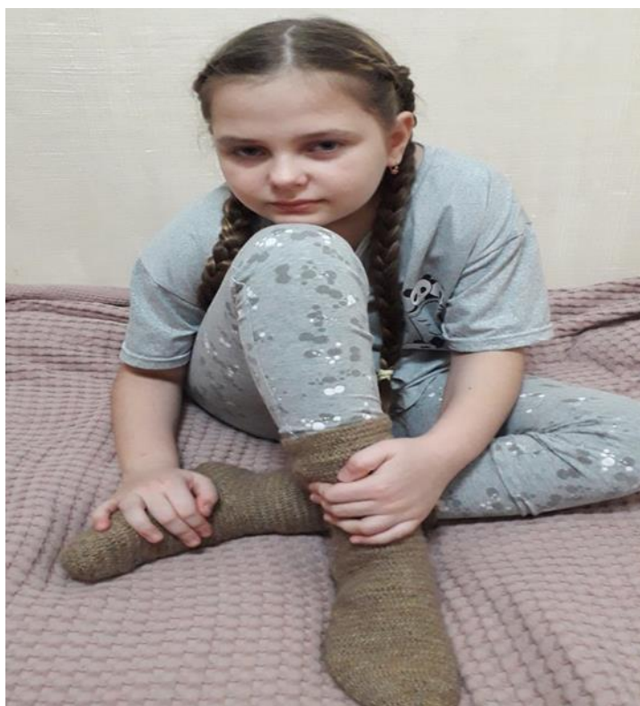
Рисунок 3. Процесс вязания одной иглой

Закончив вывязывание изделия, нить затягиваем, закрепляем и обрезаем. Изделие выворачиваем на изнанку – это будет лицевая сторона. Изделие завершено. Носок готов (Рисунок 4).