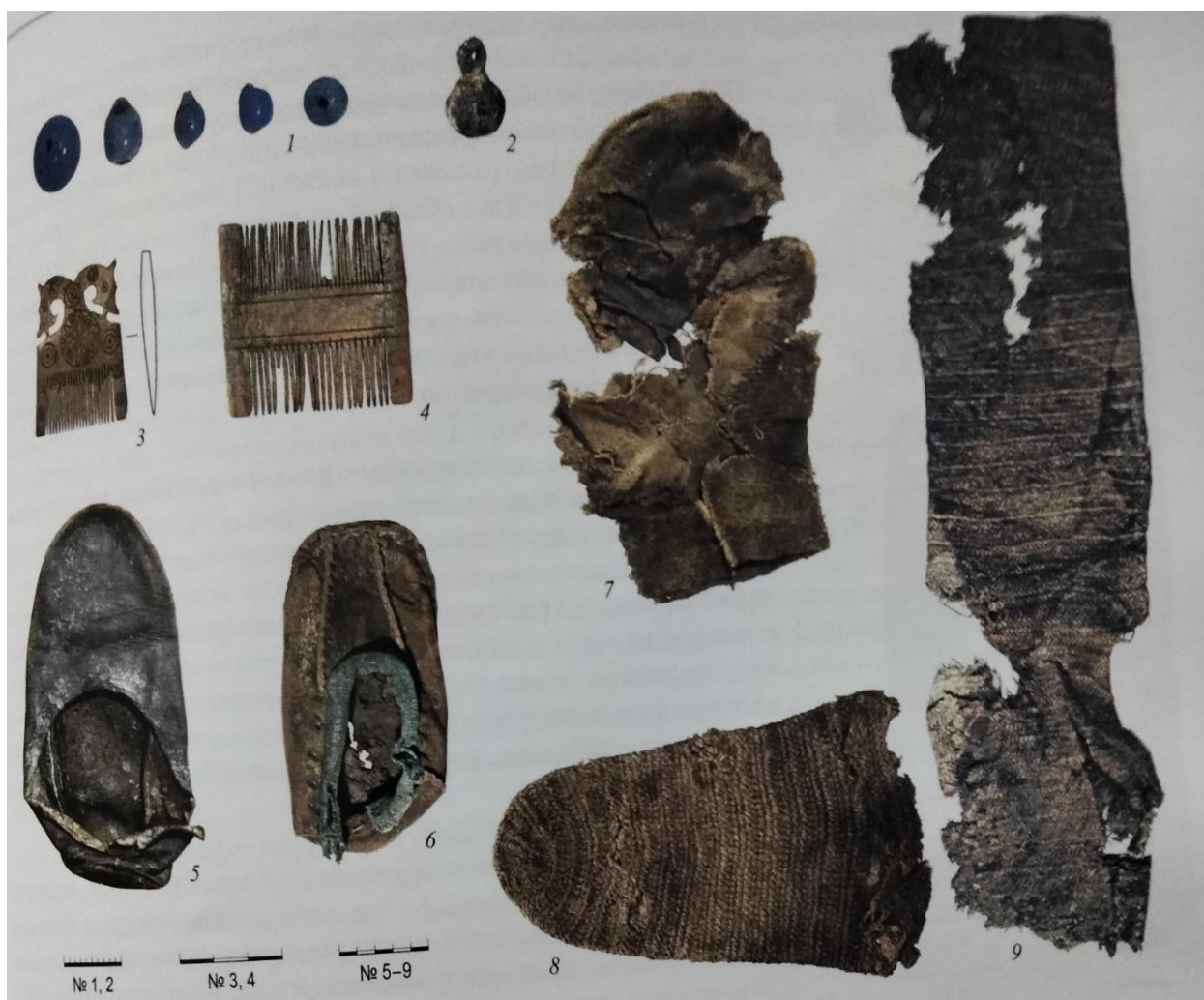
Рисунок 1. Иллюстрация из книги «Мангазея: усадьба заполярного города» [1]

О более позднем периоде рассказывают «мангазейские» и «березовские» реконструкции носков и варежек. Материал находок, сделанных в городах позднего средневековья, уникален в том плане, что в нем содержится большой объем материала по ткачеству, плетению и вязанию периода XVI – XVIII веков, как европейского, так и местного русского производства (Рисунок 1). Изделия получались не только теплыми, но и очень прочными. А это немаловажное качество шерстяного изделия. Хорошей сохранности текстиля способствовали условия вечной мерзлоты [2].