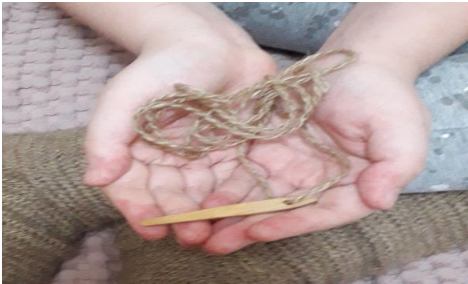
Рисунок 2. Игла для вязания

Второй этап работы. Начальная петля и начальный ряд.