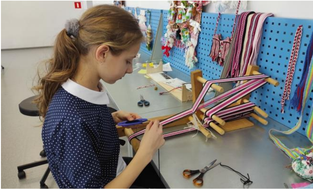
Рисунок 3. Процесс ткачества

Готовый пояс получился именно таким, каким мы его и задумали. Цель проекта достигнута, мы изучили историю браного ткачества и изготовили образец с браным узором на лентоткацком станке (Рисунок 4).