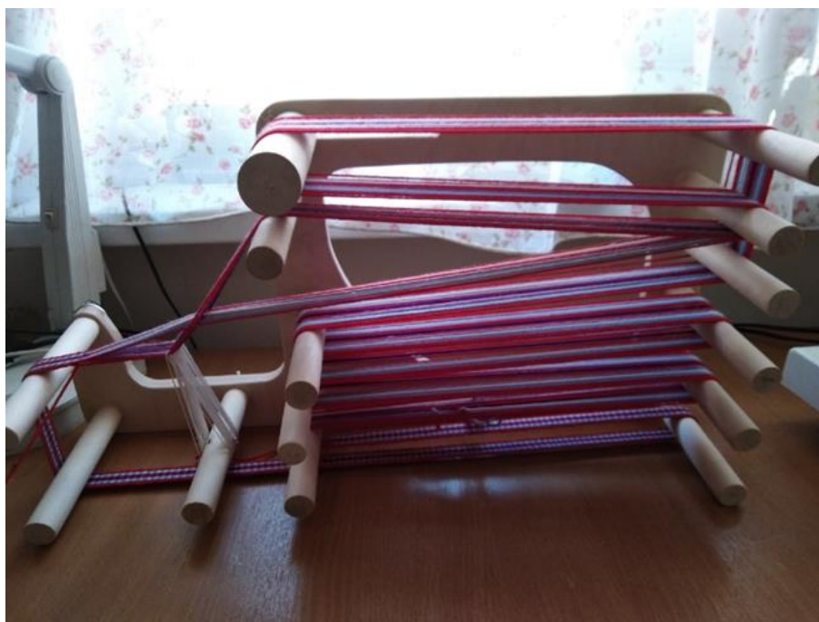
Рисунок 1. Лентоткацкий станок

Для ткачества поясов, ленты и тесьмы можно использовать различные приспособления: дощечки, бердо и т.д. Однако, при выборе любого из этих приспособлений, приходится думать над тем, где натянуть нити для пояса, как их удобнее разместить, чтобы уменьшить напряжение мышц спины ткача, как обеспечить нормальное натяжение нитей, возможно, появятся сложности при необходимости переместить ткущееся изделие. Лентоткацкий станок не является полноценным ткацким станком, так как готовое изделие получается ограниченных размеров (в зависимости от количества штекеров можно получить ленту длиной до 400 см). Однако он занимает мало места, его можно установить на удобной для ткача высоте, легко транспортируется (даже заправленный) и позволяет регулировать натяжение нитей. Именно поэтому для ткачества нашего пояса мы выбрали лентоткацкий станок (Рисунок 1).