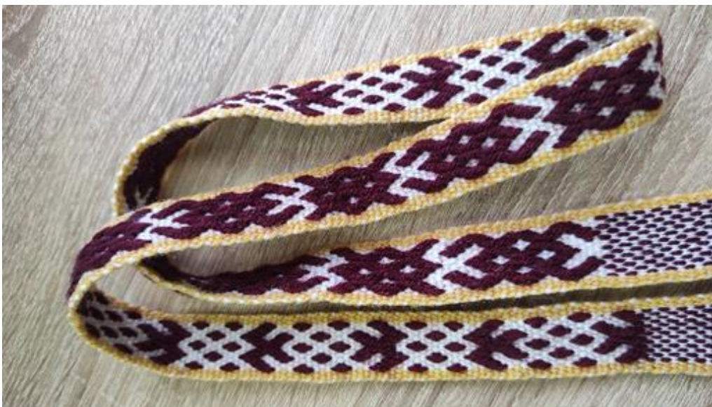
Рисунок 4. Образец браного пояса

Готовый пояс получился именно таким, каким мы его и задумали. Цель проекта достигнута, мы изучили историю браного ткачества и изготовили образец с браным узором на лентоткацком станке (Рисунок 4).