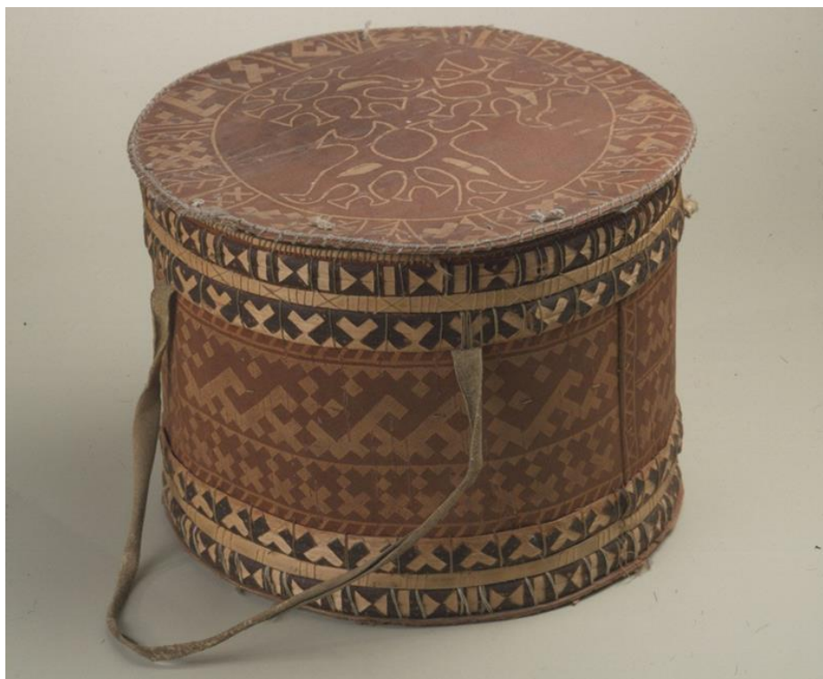
Рисунок 2. Выскабливание и аппликация по бересте

Тиснение. Его выполняют тупой стороной ножа, и чаще всего узор имеет сетчатый характер. Штампы для украшения сосудов изготавливали из оленьего или лосиного рога, на поперечном срезе которого вырезали узор. Орнамент, выполненный с помощью штампа, имеет геометрический характер и часто напоминает след какого-либо зверя. В настоящее время используются современные металлические штампы (Рисунок 4).