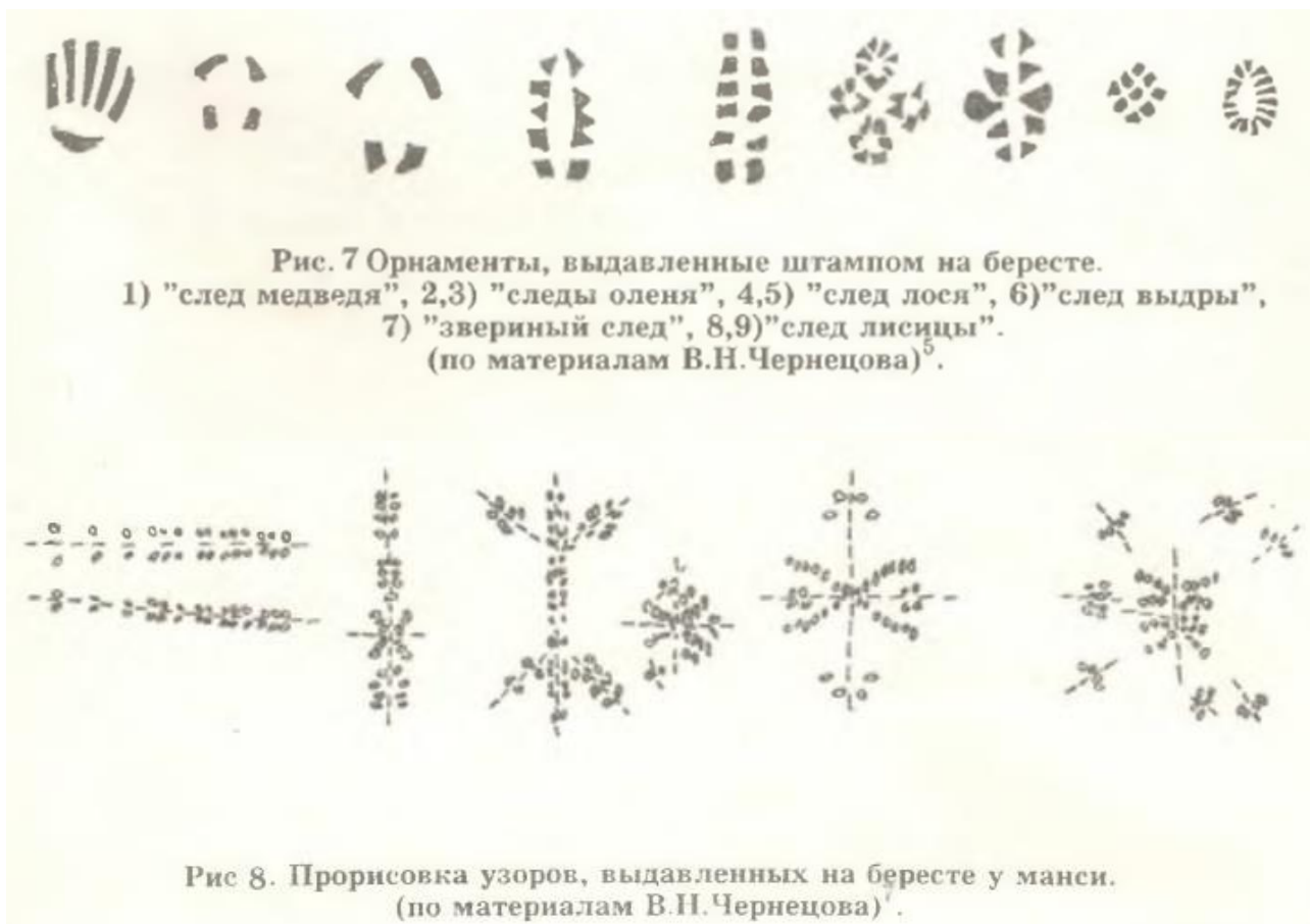
Рисунок 2. Традиционные хантыйские орнаменты на бересте [1]

Ханты использовали разнообразные орнаменты и узоры на штампах из бересты, отражая свою уникальную культуру и традиции. На Рисунке 2 представлены некоторые из характерных орнаментов, которые использовались на штампах. Всего применяется 9 способов орнаментации бересты. Темами для выдавливания фигур служили различные предметы, чаще всего и главным образом изображались следы различных животных и птиц.