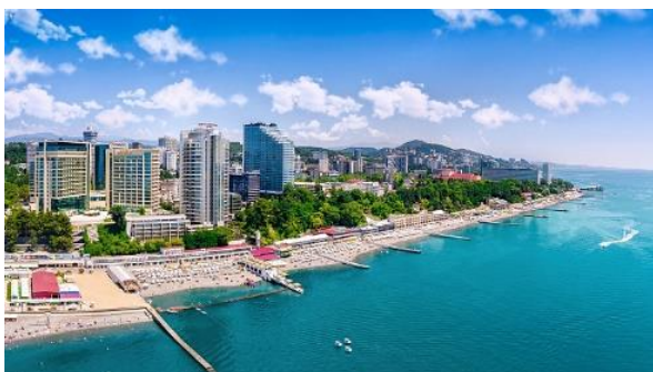
Рис. 2. Побережье современного города Сочи [4].

Определяя географическое положение городов, мы установили, что они находятся на одной географической широте 43^{\circ} с.ш. Площадь Владивостока составляет 331,2 \text{ км}^2 , площадь Сочи - 176,8 \text{ км}^2 . Расстояние между городами по прямой около 7000 км (рис. 3). В обоих городах рельеф можно определить как гористый.