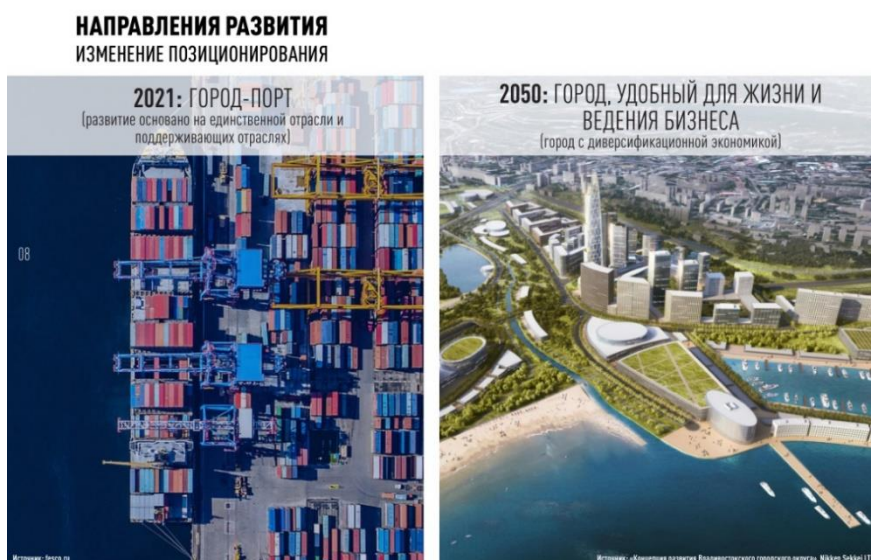
Рис. 4. Развитие г. Владивосток

ряда мер и программ развития население города к 2050 году может достигать 2,5 млн. человек [7].