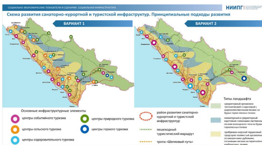
Рис. 5. Схема развития г. Сочи.

Приоритетными задачами являются развитие санаторно – курортного кластера, социальной инфраструктуры, обеспечение комфортного проживания и возрождение субтропического земледелия [8].